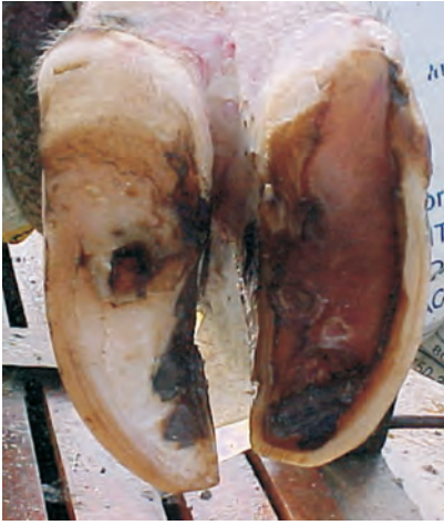
Lesiones secundarias: pezuña izquierda con úlcera podal y pezuña derecha con doble suela.