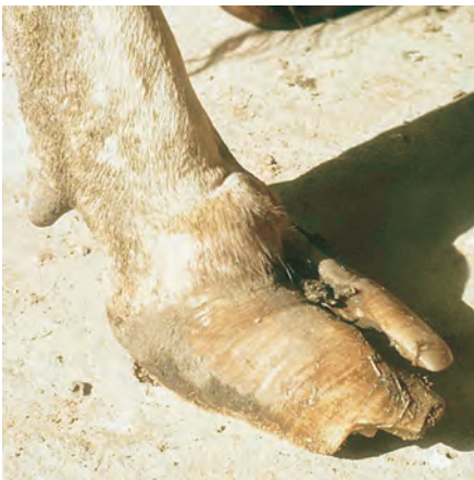
Pié con pezuñas con laminitis crónica