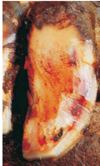
Manchas de sangre en suela