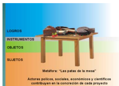
Figura 1: EIDT, metáfora de la mesa.

Desde este punto de vista, es preciso cuestionarse las condiciones bajo las que la “mesa” del EIDT es (o puede ser) tan horizontal como se requiere y como quisiéramos. Los casos siguientes permiten reflexionar acerca de los actores y sus capacidades para “modelar” los escenarios de intervención, de liderar y determinar transformaciones territoriales, de identificar oportunidades de crecimiento alternativo y de ofrecer las bases de conocimientos científicos necesarios para delinear estrategias y políticas para construir territorios sustentables.