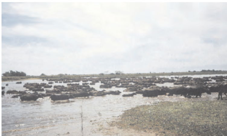
Rodeo de búfalos cruzando el río Corrientes, cerca de los corrales de Santa Rosa, Esquina, Corrientes.

La Estancia Santa Rosa abarca 45200 ha, de las cuales 14.000 de lomas y bañados, pobladas con vacunos, y 30.000 de islas (entre el arroyo Batelito y el río Paraná) destinadas a la producción de búfalos, dentro de un sistema muy extensivo.