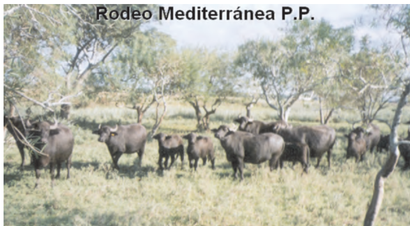
Rodeo de búfalas Mediterránea PP con bucerros de 1 ½ meses. Estancia Imará, Mantilla, Corrientes.

La Estancia Imará son 1511 ha, de las cuales más de la mitad son los esteros del Valengo (que forma parte del sistema integrado por los esteros del Batelito y del Batel, y por la laguna del Iberá), que consta de juncales embalsados con costas de gramillares y algunos albardones chicos. El resto son tendidos y lomas arenosas. Se hace cría de vacunos y el ciclo completo con búfalos.