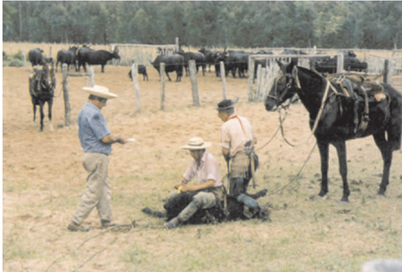
Identificación de bucerros de plantel P.P. con tatuaje y caravana. Estancia Imará, Mantilla, Corrientes.