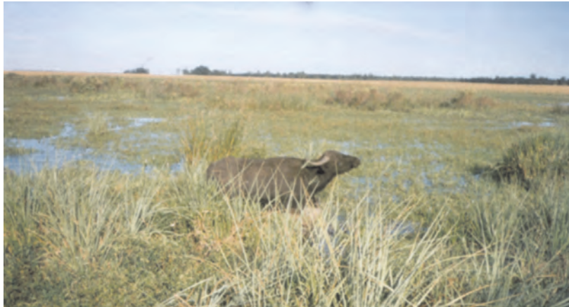
Búfala Mediterránea PP en costas del Estero Valengo con gramillares. Estancia Imará, Mantilla, Corrientes.

La Estancia Imará son 1511 ha, de las cuales más de la mitad son los esteros del Valengo (que forma parte del sistema integrado por los esteros del Batelito y del Batel, y por la laguna del Iberá), que consta de juncales embalsados con costas de gramillares y algunos albardones chicos. El resto son tendidos y lomas arenosas. Se hace cría de vacunos y el ciclo completo con búfalos.