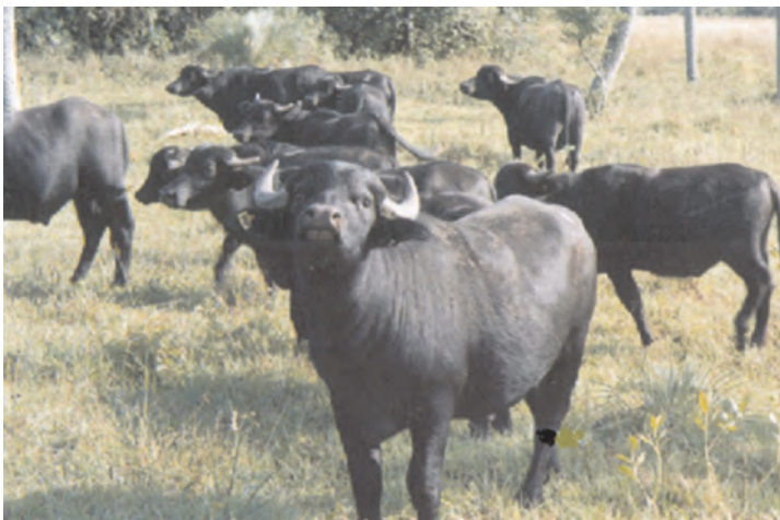
Búfalo Mediterránea PP de 24 meses con 600 kg. a campo natural. Estancia Imará, Mantilla, Corrientes.

Las pariciones de los búfalos en 14 años variaron de entre el 86 y 100%, según como venga el año.