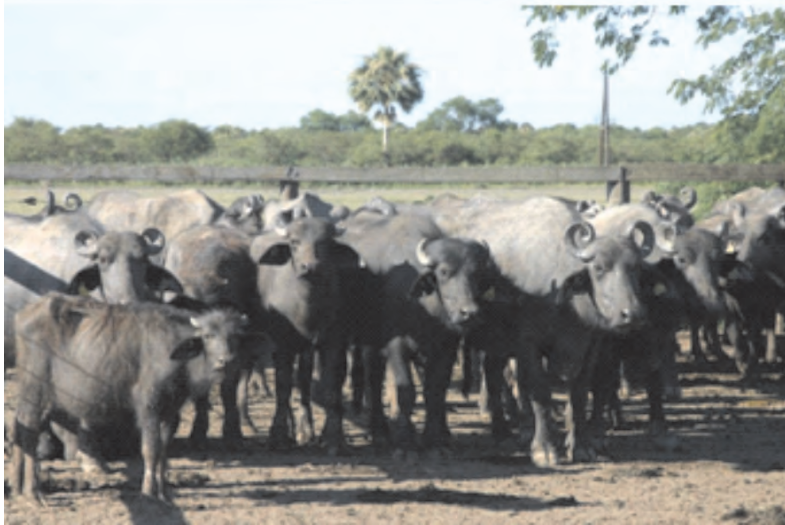
Plantel Murrah PP de la Estancia Guazú Cuá, Montelindo, Formosa.

La Estancia Guazú Cuá , con 28.600 Has. de tendidos, lagunas, esteros, albardones y montes (de los cuales 24.600 son aprovechables), es el único establecimiento en el país dedicado exclusivamente a búfalos. Tiene 11.000 cabezas en 24.600 ha.: son 0,45 cab / ha.