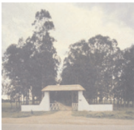
Entrada de la Estancia Santa Rosa, Esquina, Corrientes.

La Estancia Santa Rosa abarca 45200 ha, de las cuales 14.000 de lomas y bañados, pobladas con vacunos, y 30.000 de islas (entre el arroyo Batelito y el río Paraná) destinadas a la producción de búfalos, dentro de un sistema muy extensivo.