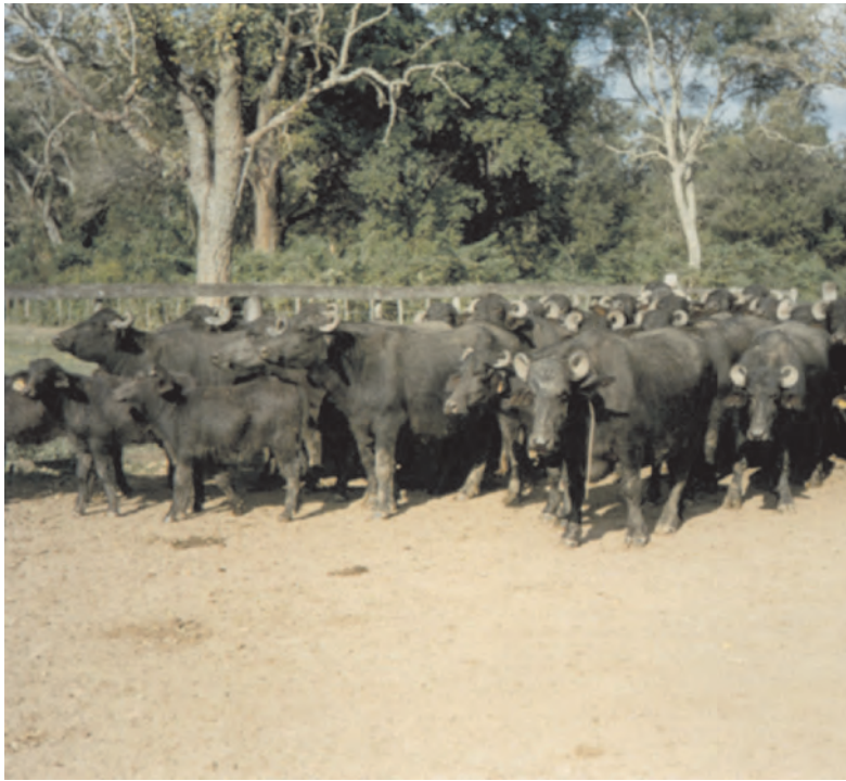
Rodeo Murrah Puro de Pedigree en la Estancia Guazú Cuá, Montelindo, Formosa.