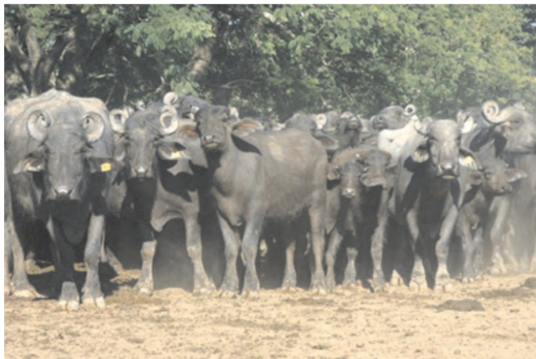
Plantel Murrah PP en corrales, atentos a su tratador.

La Estancia Guazú Cuá , con 28.600 Has. de tendidos, lagunas, esteros, albardones y montes (de los cuales 24.600 son aprovechables), es el único establecimiento en el país dedicado exclusivamente a búfalos. Tiene 11.000 cabezas en 24.600 ha.: son 0,45 cab / ha.