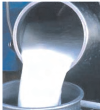
Vertiendo la leche ordeñada.