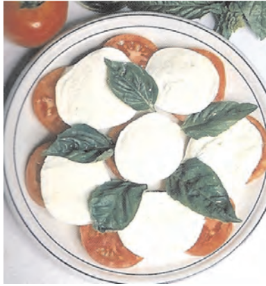
Un plato de ensalada caprese (mozzarella de búfala cortada con albahaca y tomate).

La producción lechera y su industrialización no son significativas. Hay dos tambos que tienen control oficial de producción lechera. Uno lleva 16 años de control y el otro es reciente. Hay nichos de mercado para los quesos, por la gran influencia en la cultura gastronómica italiana en las poblaciones urbanas.