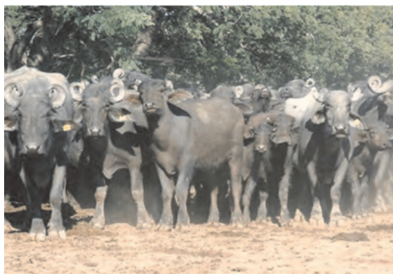
Planteles Murrah PP, Estancia Guazú Cuá, Montelindo, Formosa.

El búfalo en el subtrópico mantiene su estado de confort hasta los 48° C, siempre que en las horas de mayor irradiación solar pueda contar con agua, o en su defecto, sombra. No ayuda a su adaptación el color negro y mayor grosor de la piel, ni su menor cantidad de glándulas sudoríparas. Sí ayuda a su adaptación el mayor desarrollo de las glándulas sebáceas (el cebo refracta los rayos solares), la producción de melanina en la base de la epidermis (capta los rayos ultra violetas), y la mayor capacidad torácica y pulmonar (mayor eliminación