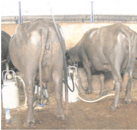
Búfalas en ordeño con sistemas individuales, en India.

La producción lechera y su industrialización no son significativas. Hay dos tambos que tienen control oficial de producción lechera. Uno lleva 16 años de control y el otro es reciente. Hay nichos de mercado para los quesos, por la gran influencia en la cultura gastronómica italiana en las poblaciones urbanas.