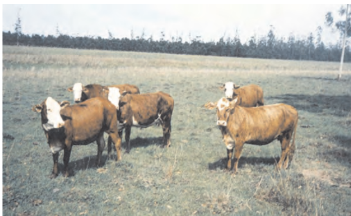
Vaquillas Braford Registrado 1ª parición en Ea. Imará.

Control de producción: El peso promedio de destete es de 207 a 248 kilos con 8 meses; y los pesos promedio a los 24 meses, de 486 a 520 kilos. Todo a campo natural, y por ello varían los promedios según el año.