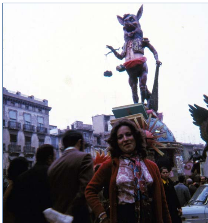
Fallas Valencia, España, 1972