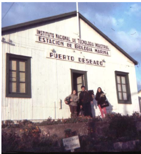
Puerto Deseado, 1967