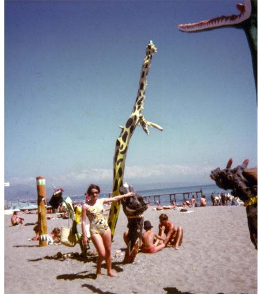
Málaga, España, 1972 Alcazaba y Torremolinos respectivamente