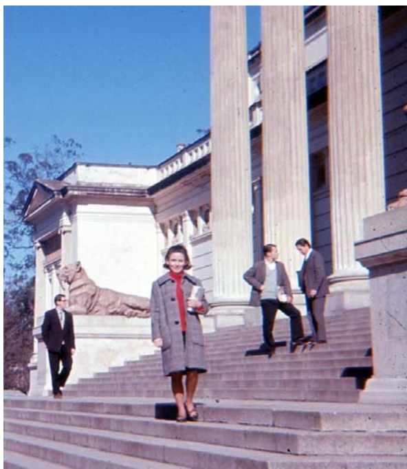
En la escalinata del Museo de La Plata, FCNyM, UN