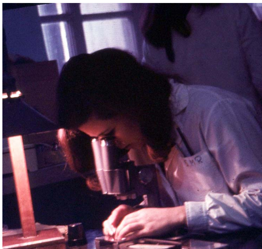
Laboratorio de Ictiología, Museo de La Plata, FCNyM, UNLP, década del 60