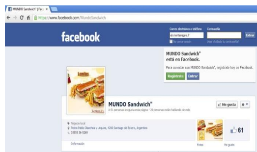
Figura [ 5 ]

A continuación se presentan las imágenes de algunas tiendas virtuales en Facebook