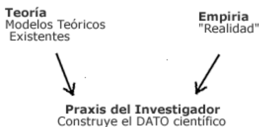
Cuadro 1. De acuerdo con este esquema, el investigador será quien resuelva esta tensión dialéctica Teoría-Empiria

las maneras más apropiadas y posibles para llegar a buen puerto, hasta los resultados finales de la investigación- se suceden cambios, tanto en lo que pensábamos y sabíamos del asunto de interés como también en los aspectos y relaciones que fuimos descubriendo. Esto nos permite entender el fascinante oficio de investigar como praxis que opera para una construcción del dato 1 , en un esfuerzo por alcanzar una mayor comprensión del mundo en que vivimos. De modo tal que el aporte filosófico de la dialéctica hegeliana está impregnando esta manera de concebir a la práctica de la investigación, dado que ella no se producirá de manera lineal ni mecánica, y en ese ida y vuelta de acciones y decisiones los investigadores iremos “superando” las tensiones o contradicciones entre: