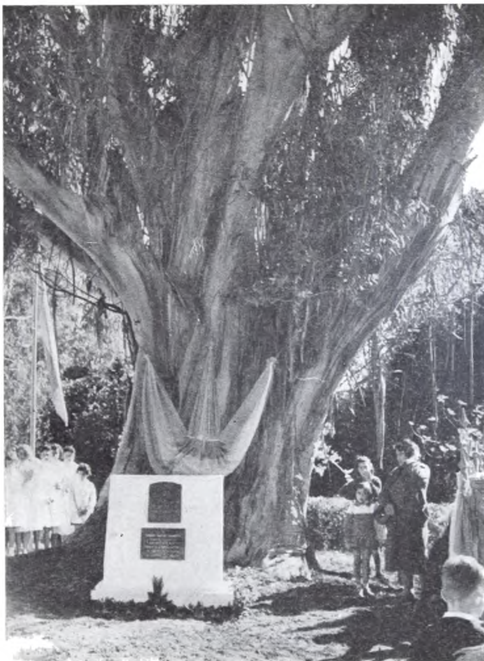
Placas recordatorias colocadas al pie del "Arbol Histórico", en su centenario, septiembre 11 de 1958