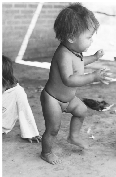
Figura N° 2: niño Mbya dando los primeros pasos solo

Con relación a ello, la oportunidad, características y frecuencia de movimientos y desplazamientos dependen de las características del espacio en el que el niño o niña puede y/o quiere moverse, lo que hace posible entender en qué circunstancias los cuidadores y cuidadoras permiten o restringen sus desplazamientos. Al respecto, existen ocasiones en las cuales se limita intencionalmente el desplazamiento del niño o niña, y es cuando se considera que puede existir un riesgo para él o para ella, o cuando el cuidador o cuidadora no puede abandonar la tarea que está realizando para seguir sus movimientos. No obstante, en general los padres y las madres permiten que sus niños y niñas se desplacen y se muevan a través del patio y de los alrededores de la casa. Excepto durante el sueño, cuando los lactantes permanecen dentro del ky’á (hamaca) por algunas horas (Ver figura N° 2), no hay ningún otro objeto o construcción que sirva a los fines de restringir el movimiento de los niños y niñas. Por el contrario, cuando comienzan a reptar o gatear se les permite “explorar” el entorno durante sus desplazamientos, los que al comienzo son cortos y atentamente vigilados por sus cuidadores y cuidadoras. Asimismo, si bien se asiste a los niños y niñas durante sus primeros pasos, se deja libertad para que ensayen el equilibrio y la marcha sosteniéndose de diferentes elementos disponibles en el espacio de la galería o patio, como así también del cuerpo de otras personas.