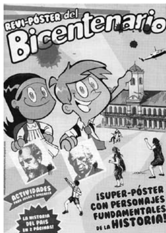
Figura 1: Tapa del reví-póster