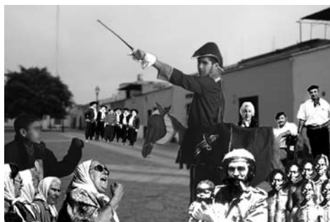
Figura 4: Fotonovela

panteón de héroes nacionales y de sus enemigos, introduciendo nuevos personajes propios de tiempos más modernos, demarcó claramente las posiciones políticas en juego, delimitando así dos líneas transhistóricas visiblemente opuestas (“la antipatria” y “los verdaderos constructores del país”). Naturalmente, el uso del anacronismo (situar a Guevara o a las Madres en aquellos años) habría requerido un trabajo de “pulido” posterior, para recalcar la función metafórica y asegurar que no se perdiera la comprensión de la distancia temporal. Pero aun así la conexión realizada entre pasado y presente habilitaba una interesante vía de ingreso a la historia. Los eventos del pasado fueron resignificados: el eje del relato dejó de ser la emancipación nacional frente al colonialismo español, para pasar a iluminar en cambio la lucha contra la desigualdad y la exclusión dentro del país. Los clivajes de clase y étnicos estuvieron bien presentes. No deja de llamar la atención el hecho de que, a pesar del cambio drástico de significados que se le otorgó a aquel momento histórico y a sus protagonistas, algunas figuras tradicionales, como San Martín y Moreno, continuaron impolutas en su lugar de héroes, algo que ciertamente nosotros no habíamos promovido en nuestro trabajo (aunque tampoco combatido explícitamente). Probablemente indique una influencia del canon escolar o de la guía pedagógica que tuvieron al confeccionar la fotonovela.