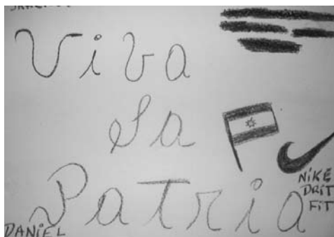
Figura 2: Pancarta

fuere. En esta pancarta (Figura 2), la simbología de la patria aparece casi en plano de igualdad con el logo de Nike, la marca de zapatillas que para muchos jóvenes representa uno de los consumos más anhelados y el pasaporte de inclusión en la ciudadanía del consumo, la única válida desde el punto de vista de la ideología del mercado en el capitalismo tardío. Aunque alguien pudiera tomarlo como una conjunción puramente casual, nos parece que la aparición del máximo símbolo del Estado (la bandera) junto con uno de los logos más conocidos de las corporaciones capitalistas actuales, en una pancarta para llevar al cabildo abierto que fundó la Nación, no deja de tener su carácter sintomático. Curiosamente, es la única pancarta que incluyó una leyenda asociable al canon escolar-patriótico (“Viva la patria”).