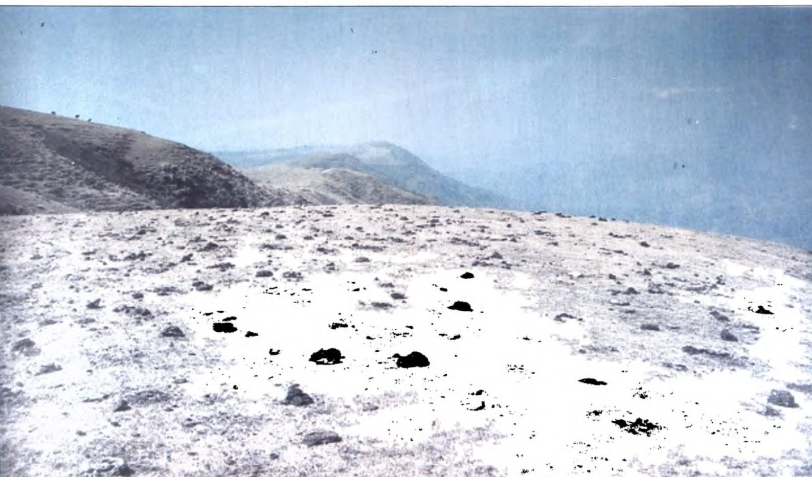
Lámina 10: La falta de vegetación permitirá que todas las deyecciones acumuladas en las cumbres, en el período seco de Abril a Noviembre, sean arrastradas aguas abajo perdiendo así la fertilidad del suelo. 2.000 m/s/m.