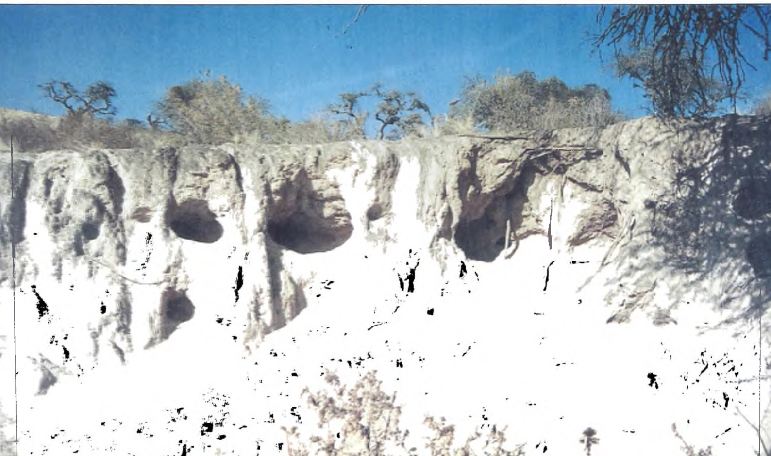
Lámina 6: En barrancos de cárcavas el consumo de tierra por el lamido del ganado, en ávida búsqueda de sales, produce profundos oquedales cuyo desplome incrementa la pérdida de suelos.