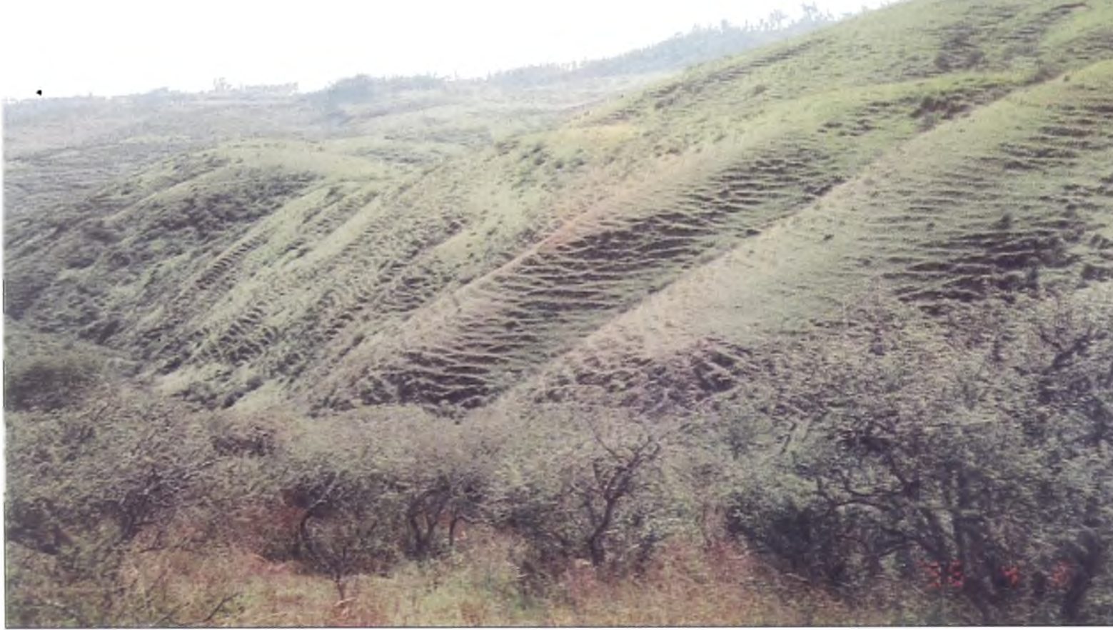
Lámina 1: Formación de Pie de Ganado en laderas de exposición Sur por efecto del sobrepastoreo. El incremento de escurrimiento ha formado la cárcava central de la fotografía N° 2. 1.900 m/s/m.