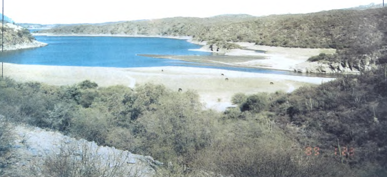
Lámina 7: Acumulación de sedimentos en la entrada del embalse Las Pirquitas, situación en Mayo de 1995.