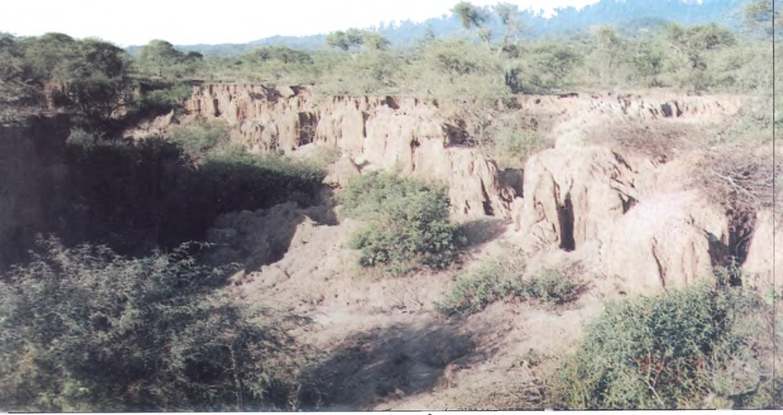
Lámina 5: El incremento de escurrimiento y erosión en cumbres y laderas produce cárcavamiento y desplomes en fondo de valles.