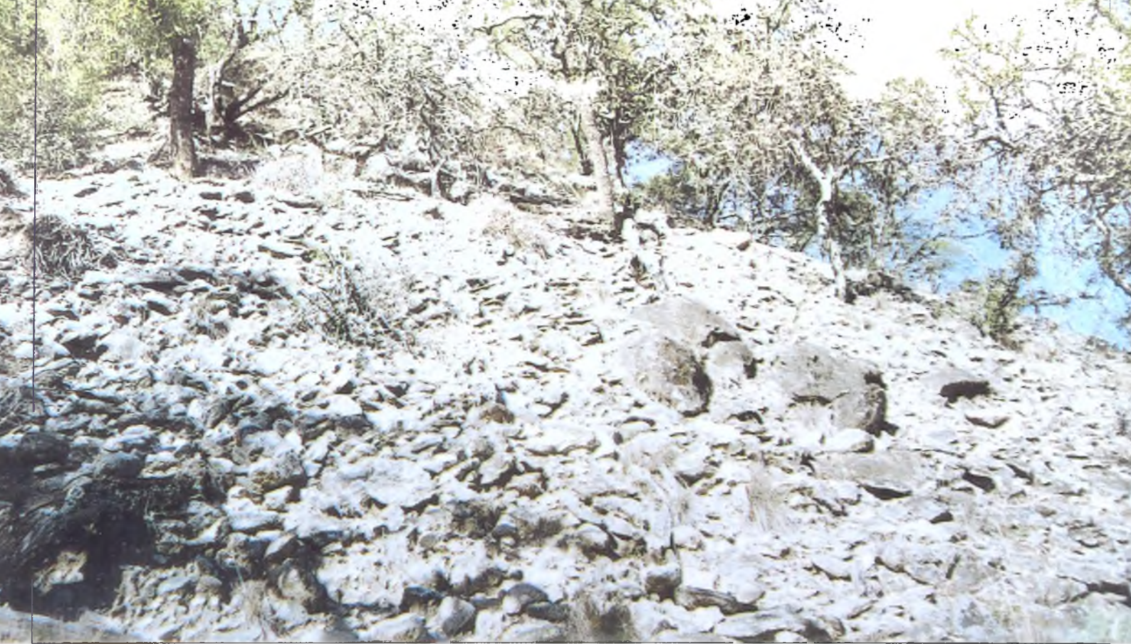
Lámina 3: La erosión en conglomerados de piedemonte eliminó la tierra, dejando solamente piedras en su superficie.