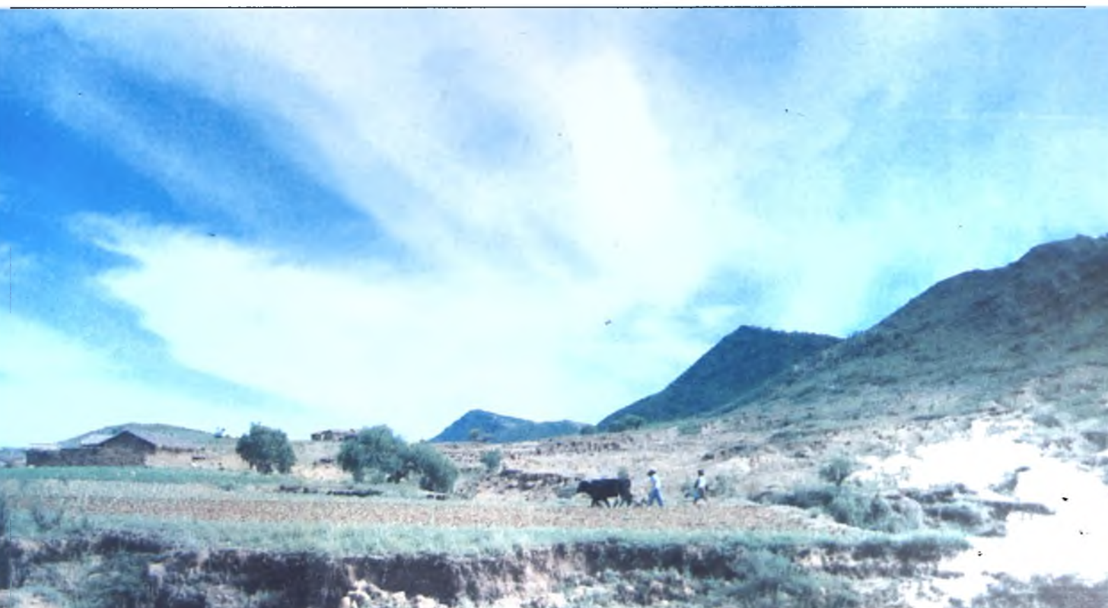
Lámina 12: La combinación de desbosque, agricultura sin sistematización de suelos y sobrepastoreo está virtualmente desplomando las montañas de Bolivia a los ríos. Cuenca del río Pilcomayo, 2.000 m/s/m.