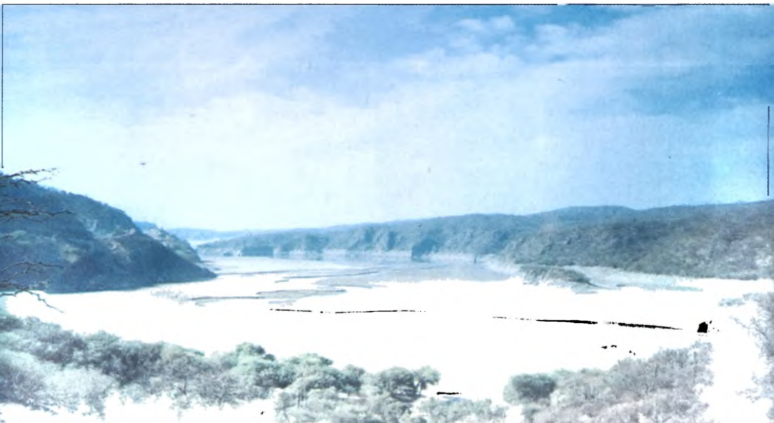
Lámina 8: El río erosiona los sedimentos acumulados en la entrada del embalse Las Pirquitas y forma cauce dentro de los mismos. Septiembre, 1995.