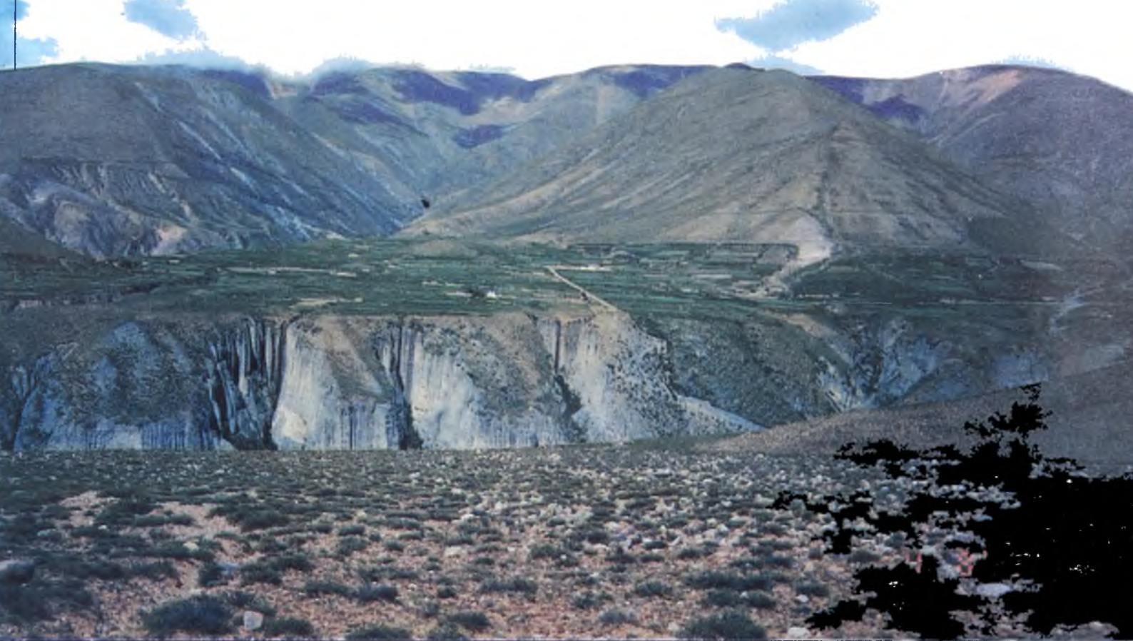
Lámina 11: El río Iruya descendió casi 100m. su nivel de base. El sobrepastoreo de laderas provocó avenidas de agua que al desplomarse al río, un salto más de 100m., van produciendo erosión retrocedente que con el tiempo destruirán a todo el Campo de los Carreras. (Dpto. Iruya, 3.000 m/s/m).