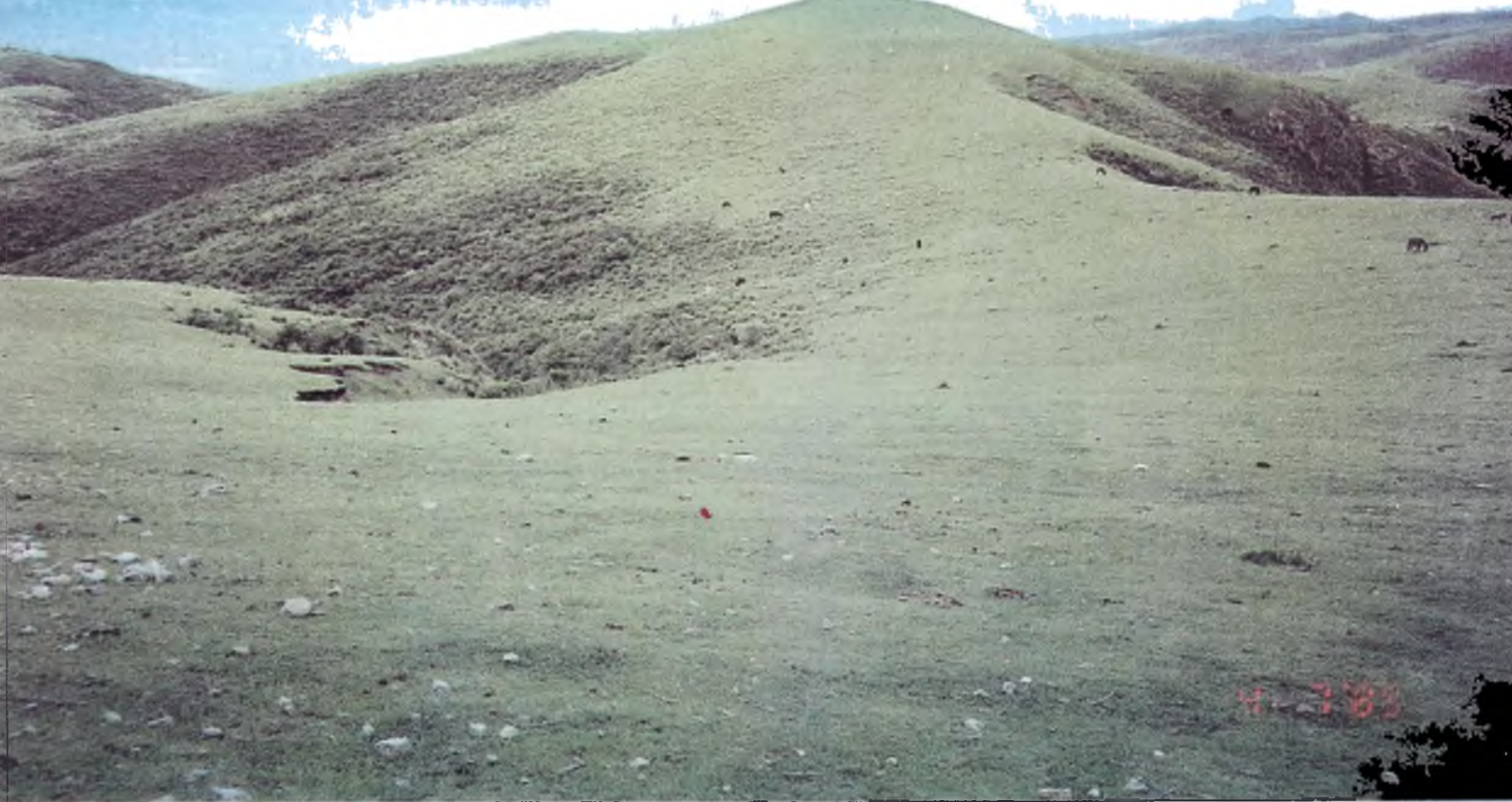
Lámina 9: Los pastizales de neblina en cumbres sufren el impacto del ganado todo el año, lo cual les da un aspecto de césped y les quita capacidad de retención de agua. A la izquierda se observan las paredes de una cárcava retrocedente. 2.000 m/s/m. Foto Saravia Toledo.