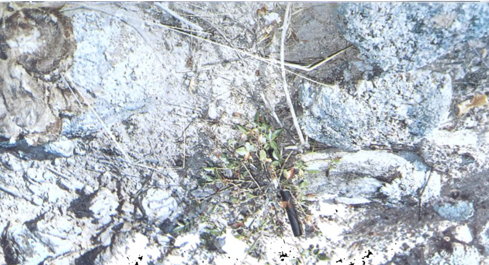
Lámina 4: En bosques de Schinopsis haenckeana (Horco quebracho) hace más de 300 años que no ha regeneración por efecto del sobrepastoreo. Ejemplar mutilado por ramoneo.