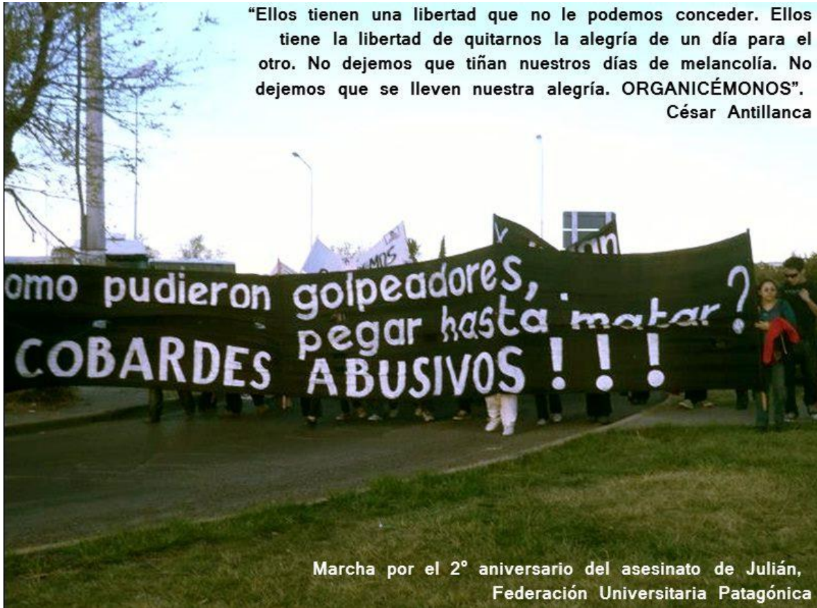
Imagen n° 5: Marcha por el Aniversario del asesinato de Julián Antillanca.