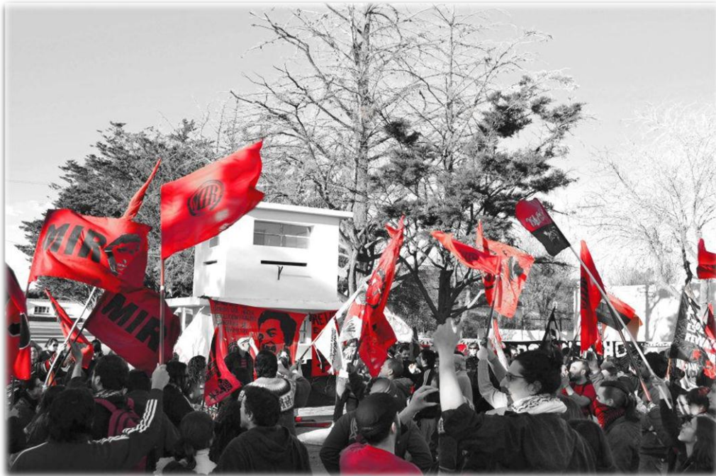
Imagen N° 7: Acto en el Aniversario N° 40 de la Masacre de Trelew Fuera del Penal de Rawson (Unidad n° 6), tomada por Axel Binder.