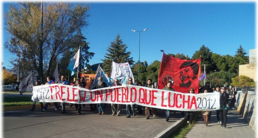
Imagen n° 6: Marcha inicial del Juicio

Un reclamo Histórico de los/as luchadores sociales de Trelew, era el Juicio a los Genocidas de la Masacre de Trelew, año tras año cada veintidós de agosto en los actos que realizábamos en el Aeropuerto “Viejo” (Hoy Centro Cultural por la Memoria) pedíamos que se haga justicia. Por fin este año, el juicio llegó.