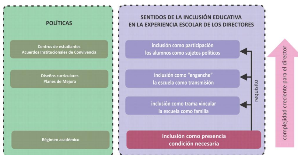
Gráfico 2: Sentidos de la inclusión educativa en la experiencia escolar de los directores

Las expresiones de los directores en las entrevistas conducen a identificar estas lógicas como las que organizan los sentidos producidos sobre el mundo escolar. A su vez, estos sentidos conducen al lugar y los límites que tiene la inclusión educativa para los directores.