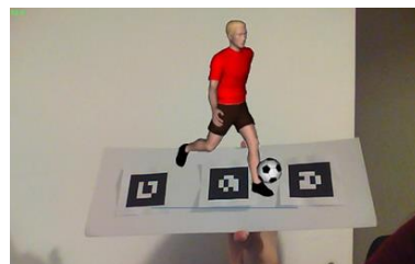
Fig. 6. Actividad de estructuración de frases.

Luego, para realizar el ejercicio de estructuración de frases, el alumno deberá presentar en forma conjunta y ordenada los cartones, de manera tal de componer la frase solicitada. Al presentarlos frente a la cámara web, conjuntamente y en el orden correcto, podrá visualizar al sujeto realizando la acción con el objeto correspondiente (Figura 6). Esto permitirá reforzar el mecanismo de estructuración de frases.