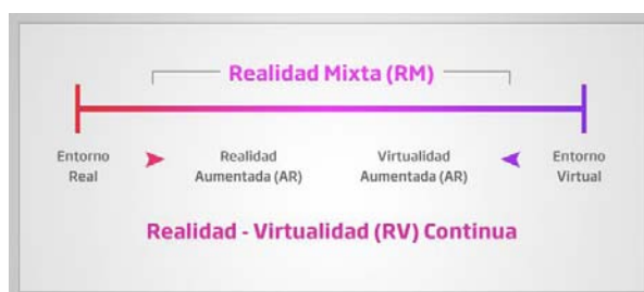
Fig. 1. Definición de realidad aumentada por Milgram y Kishino

Paul Milgram y Fumio Kishino [2] definieron en 1994 el “Reality-Virtuality Continuum” como un continuo que va desde el “entorno real” hasta el “entorno virtual”. Al área comprendida entre los dos extremos, donde se combinan lo real y lo virtual, la denominaron “Realidad Mezclada” (Figura 1).