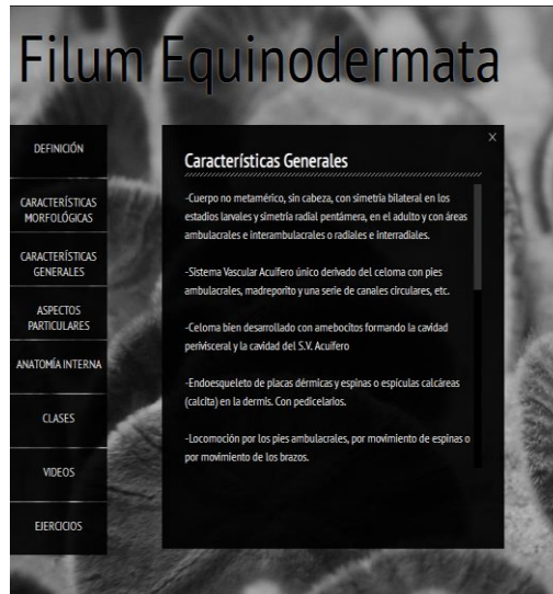
Fig.3. Ejemplo de la sección Definición

Para la sección Aspectos Particulares se ha utilizado otro efecto de animación implementado mediante JQuery. Este permite, al hacer clic sobre una imagen, que posee uno de los aspectos a ser explorado, cambiar el fondo de pantalla y presentar en él, texto correspondiente al aspecto. La Figura 4 muestra la selección de un aspecto particular y su descripción.