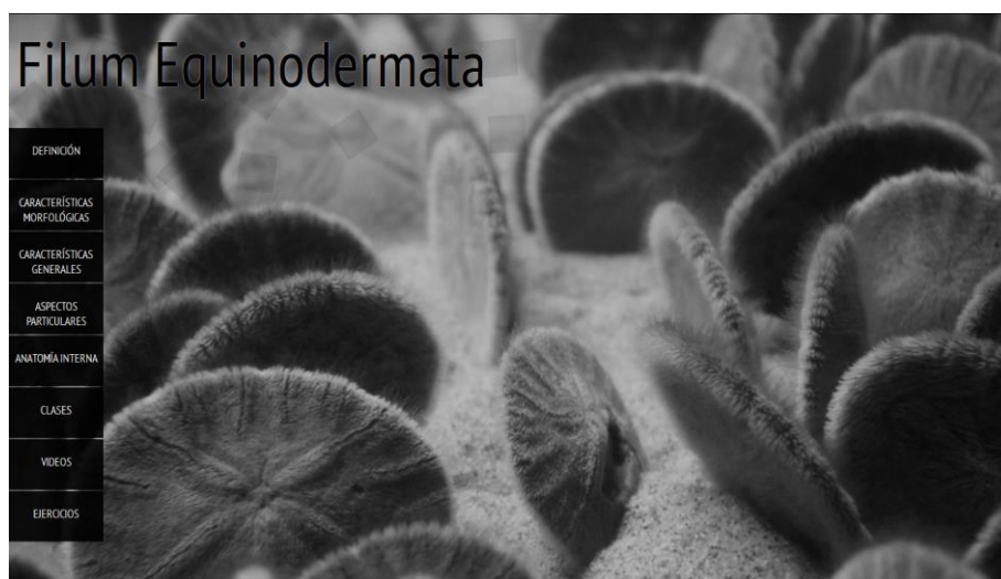
Fig.2. Pantalla principal de Filum Echinodermata

La sección correspondiente al Filum Echinodermata se encuentra dividida en ocho secciones, cada una de los cuales corresponde a un ítem del menú, que aparece a la izquierda de la pantalla. Los ítems se corresponden con las secciones presentadas en el apartado de Características General de este artículo. La Figura 2 muestra la pantalla principal de la sección Filum Echinodermata.