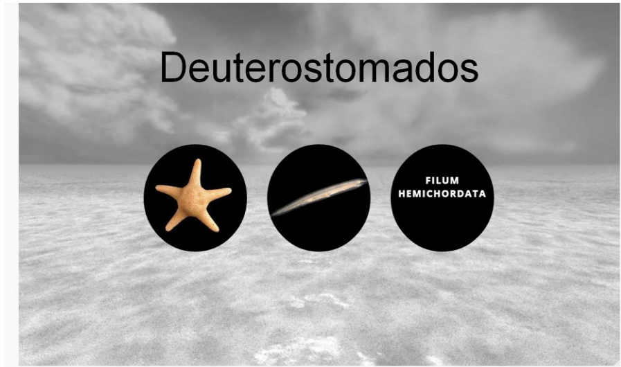
Fig.1. Menú General Deuterostomados

Dentro del módulo de Deuterostomados, es posible seleccionar uno de los Filums, acorde a la necesidad de los alumnos. En la Fig.1 se muestra el menú general que permite el acceso a cada uno de las secciones correspondientes a los Filums.