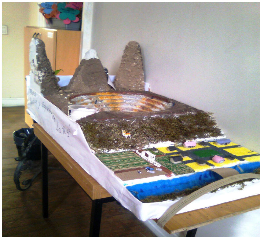
Figura 2. Maqueta: La minería a cielo abierto, su explotación.

Al cierre de la Jornada se entregaron señaladores como se muestran en las Figuras 3 y 4.