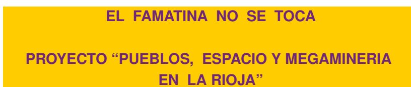
Figura 4. Señalador En defensa de la ecología riojana.