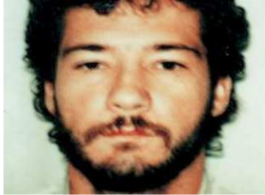
Figura 4: Publicada el 29 de abril del 2008 en la versión digital de la Revista Semana .

La foto de la Revista Semana es de Mejía con vida, parece una foto tipo documento con fondo blanco, lo muestra del cuello hacia arriba, vestido del blanco, al menos lo que se deja ver en el cuello.