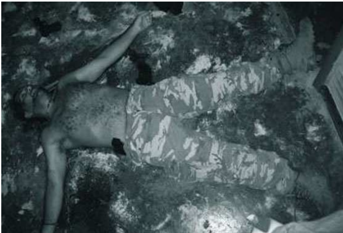
Figura 5: Publicada el 30 de abril del 2008 en la versión digital de El Espectador .