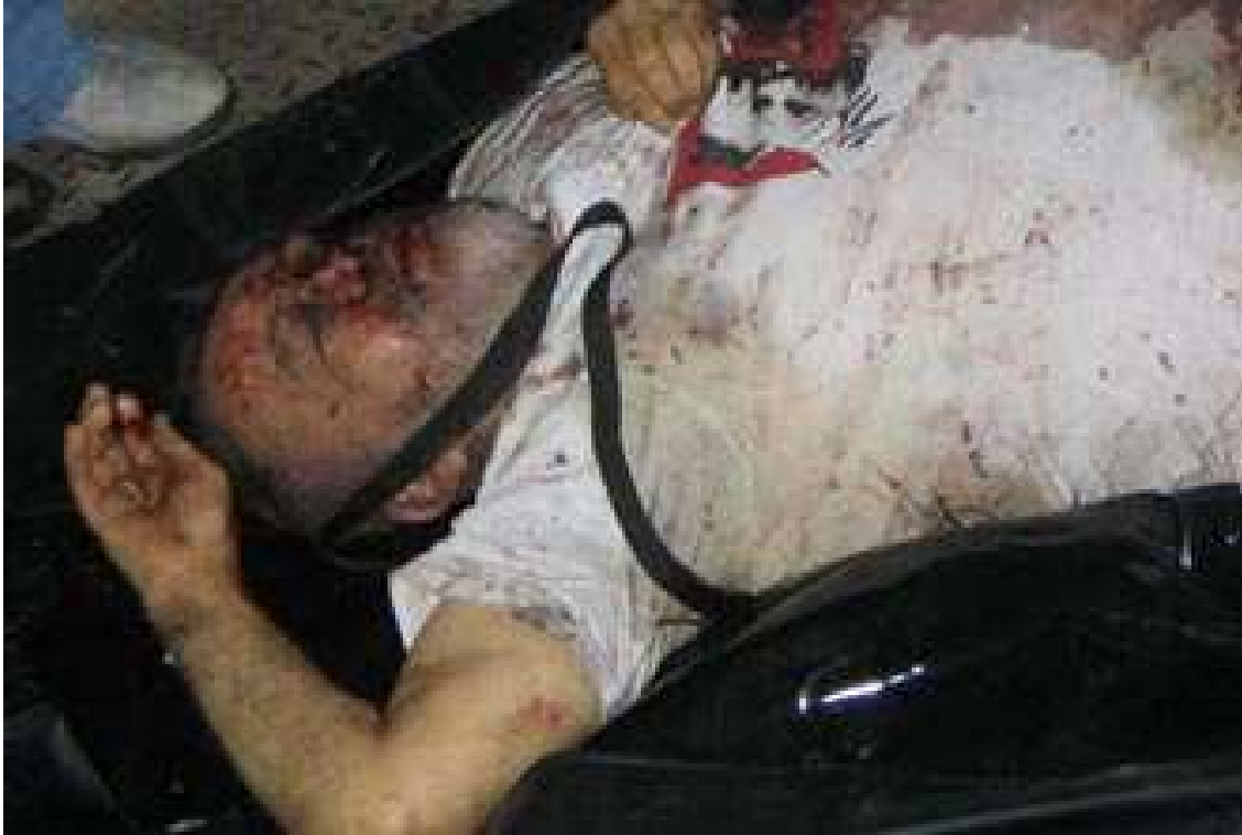
Figura 1: Publicada el 1 de marzo del 2008 en la versión digital de la Revista Semana .

En esta primera imagen se aprecia el cadáver de Raúl Reyes, que cayó muerto luego de combates con el Ejército colombiano el 1 de marzo del 2008. La foto deja ver su cuerpo desde el área del abdomen hasta la cabeza, el brazo derecho completo y la mano izquierda. Viste un suéter blanco estampado con la cara de alias "Tirofijo". La ropa, o lo que se ve de ella, muestra una gran mancha de sangre en el costado izquierdo, la cara -hinchada- tiene manchas de sangre, el ojo derecho está cerrado, el ojo izquierdo se ve morado, casi negro por la sangre coagulada, y lo poco que se ve del pómulo izquierdo muestra hinchazón, sangre, destrozo. El cuerpo del guerrillero se encuentra dentro de una bolsa para cadáveres, transparente. El cadáver está en el piso, en la parte superior de la foto se alcanza a ver una parte del calzado de una persona parada al lado del cuerpo. La imagen fue publicada inicialmente en el diario El Tiempo en su versión digital, luego la foto fue retirada.