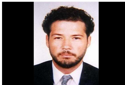
Figura 6: Publicada el 22 de diciembre del 2008 en la versión digital de El Espectador .

f. Otra foto de publicada en el Semanario El Espectador (7)