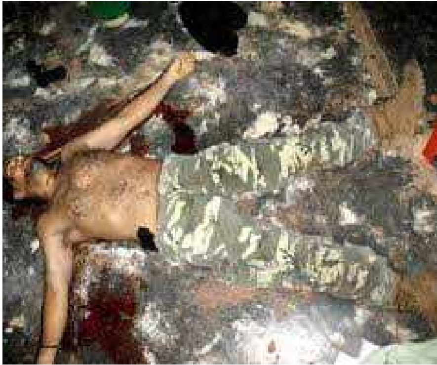
Figura 8: Publicada el 1 de mayo del 2008 en la versión digital de OEM-AP.

La foto en color es bastante más fuerte y amarillista que la foto en blanco y negro, publicada por El Espectador , al cambiarla a blanco y negro se disipa la crudeza de la imagen, haciendo que se pierdan los detalles más impactantes de la fotografía. Esta elección deja en evidencia dos cosas: la primera, que los medios no publican las fotos tal y como vienen en cuanto a cantidad y calidad, hay una selección de las imágenes; y esto lleva la segunda evidencia, la selección de las imágenes, y los retoques y modificaciones que se hagan a estas (cambiarle el tono, el contraste, la luz, desaturarla, matizarla, enfocarla, desenfocar, licuarla) guardan siempre una intención.