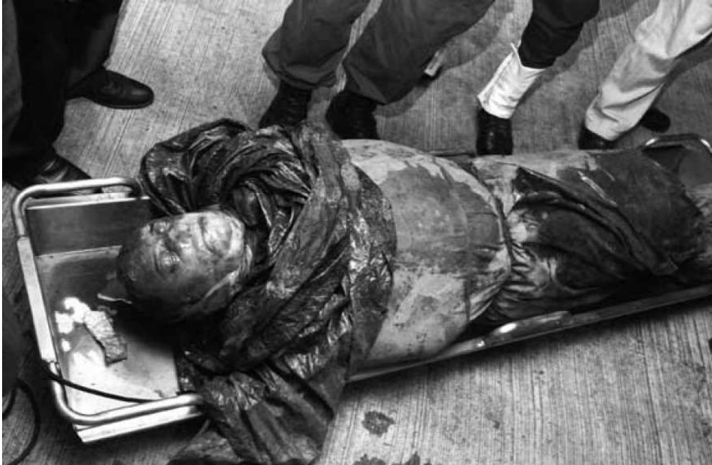
Figura 3: Publicada el 24 de septiembre del 2010 en la versión digital de El Espectador .

La foto muestra un cadáver, el del Mono Jojoy, puesto sobre una bandeja en el piso. A su alrededor, se pueden ver las piernas, de las rodillas hacia abajo, de cuatro hombres, los dos que están en el centro están vestidos de militares, el del lado izquierdo viste botas y pantalón de la Policía Nacional, el del lado derecho viste botas y pantalón de la Policía Militar PM. Los otros dos hombres visten de civil. La foto cubre el cuerpo del Mono Jojoy casi por completo, y quedan por fuera los pies. El guerrillero está envuelto hasta el cuello por una lona, el color de la lona no es uniforme, tiene dos grandes manchas, probablemente de sangre, en lo que sería el área del abdomen y de las piernas. Del pecho salen bolsas negras de basura; el cuello, el mentón y los labios parecen uno solo, totalmente hinchados, la nariz no se distingue y los ojos están muy hinchados. Hay manchas de sangre y barro en todo el rostro. Aunque está envuelto, se logra ver que el cuerpo está totalmente hinchado, deformado por la muerte violenta que sufrió el guerrillero y, seguramente, por la descomposición.