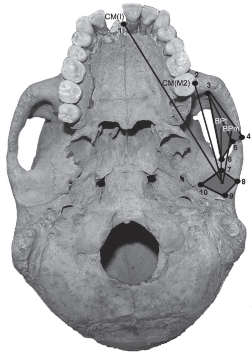
Fig. 1. Gráfico de la posición de cada landmark digitalizado. El rombo entre los landmarks 7, 8, 9 y 10 marca el área de la articulación temporo-mandibular, el triángulo entre los landmarks 3, 4 y 5 marca el área transversal del músculo masetero y el triángulo entre los landmarks 3, 5 y 6 marca el área transversal del músculo temporal. BPm:brazo de palanca del músculo masetero, BPt:brazo de palanca del músculo temporal, CM(M2):brazo de carga a nivel del segundo molar, CM(I):brazo de carga a nivel de los incisivos centrales.

Las áreas musculares transversales de cada