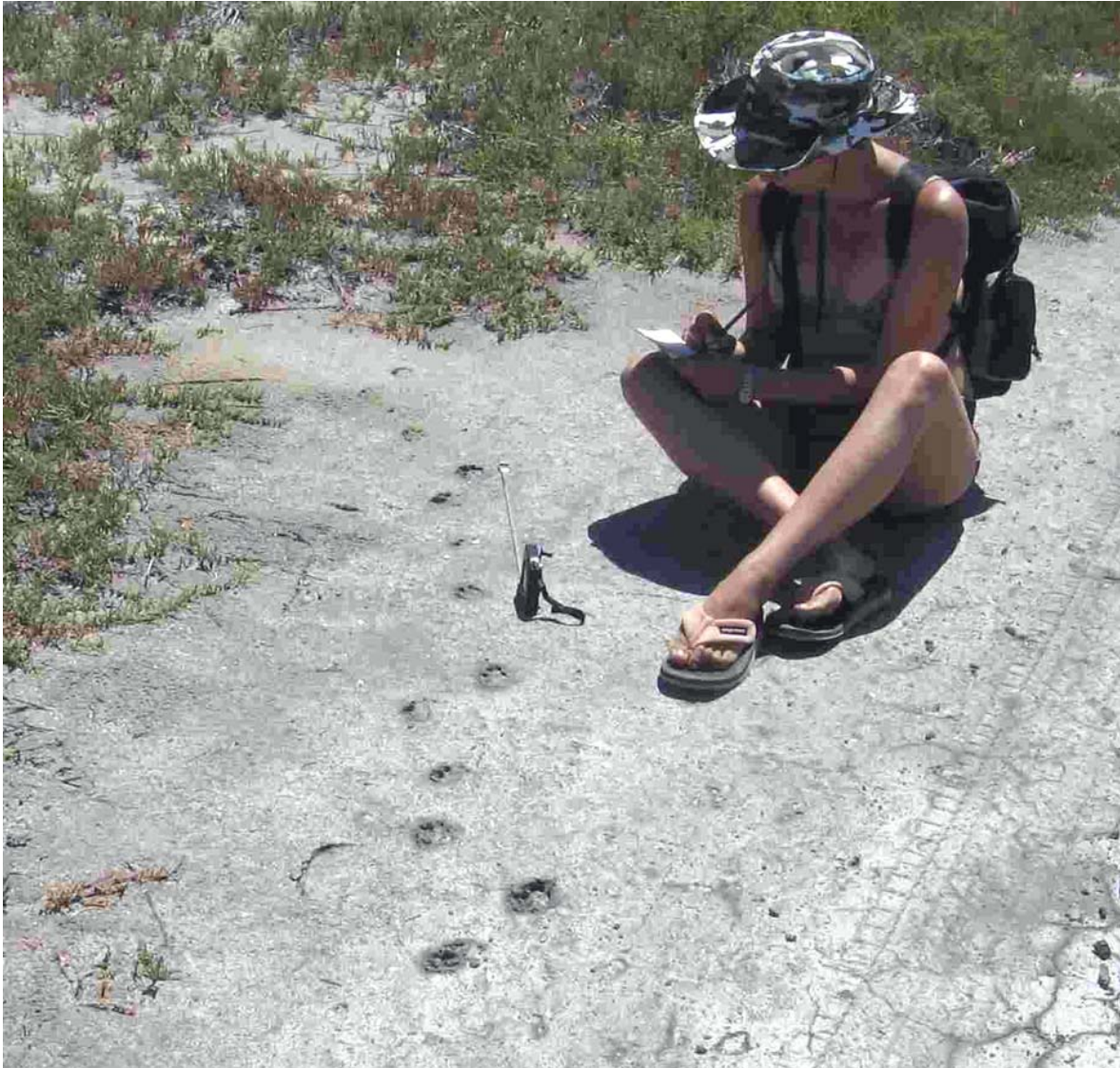
Relevamiento en la Reserva Natural Bahía San Blas, enero de 2004