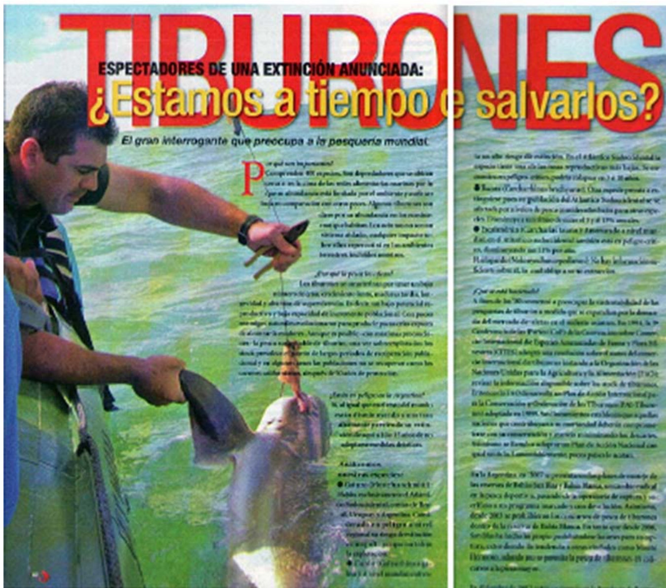
García Liotta, R. L. & A. D. Alvarez. 2009. Espectadores de una extinción anunciada: tiburones ¿estamos a tiempo de salvarlos?. En: Revista Panorama de Pesca, Año XIX nº 208, marzo