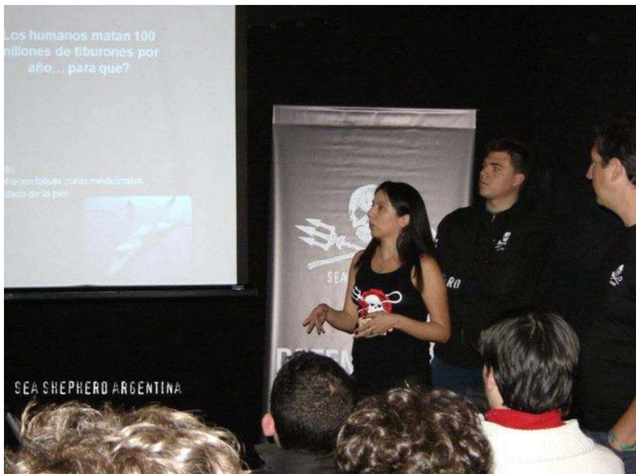
Exponiendo sobre tiburones en un evento de difusión sobre las actividades de Sea Shepherd Conservation Society, Ciudad Autónoma de Buenos Aires, 23 de setiembre de 2011