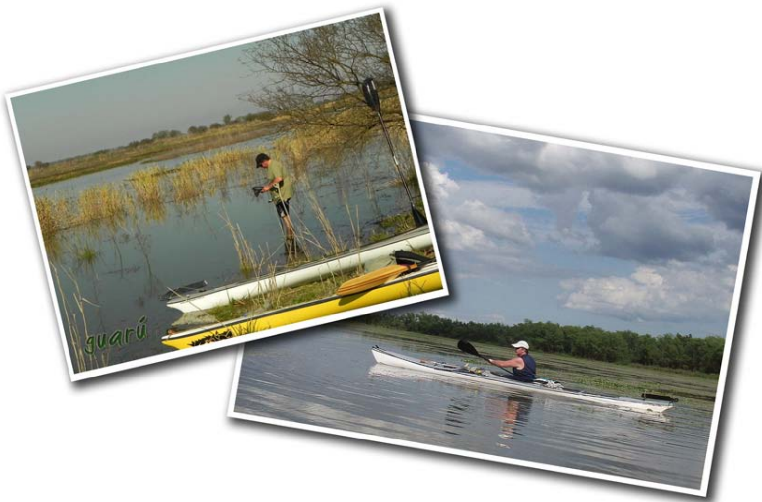
Curioseando por las islas frente a Rosario, 2013