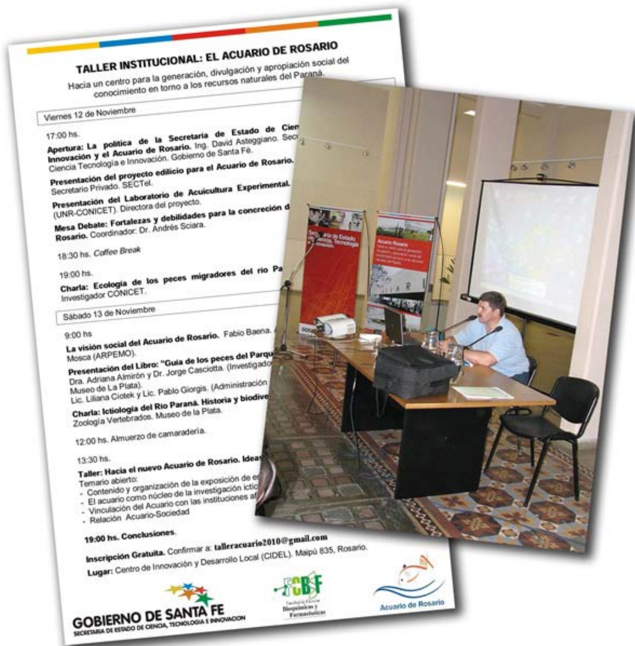
Participación en el Taller Institucional: el Acuario Rosario, 2010