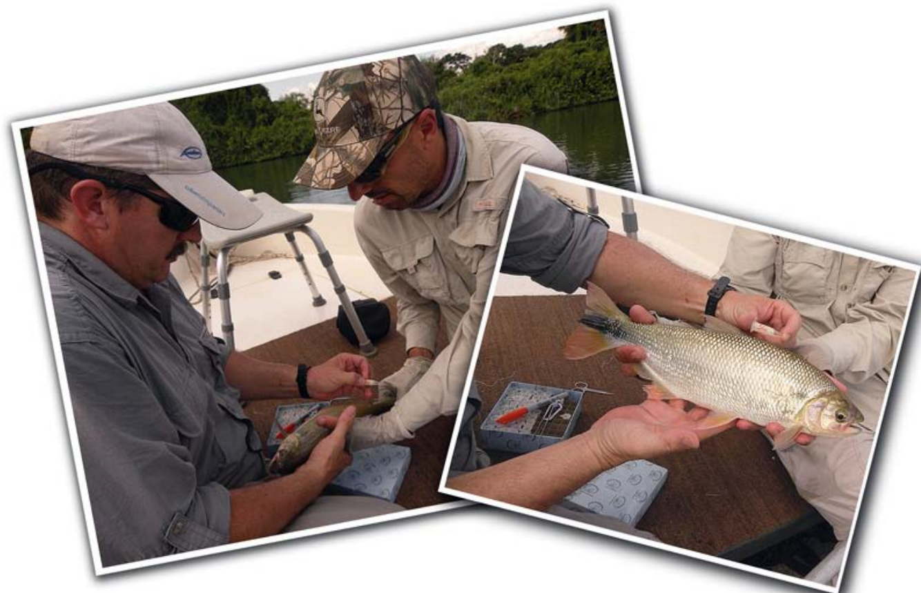
Tomando muestras de tejidos de Brycon, 2011