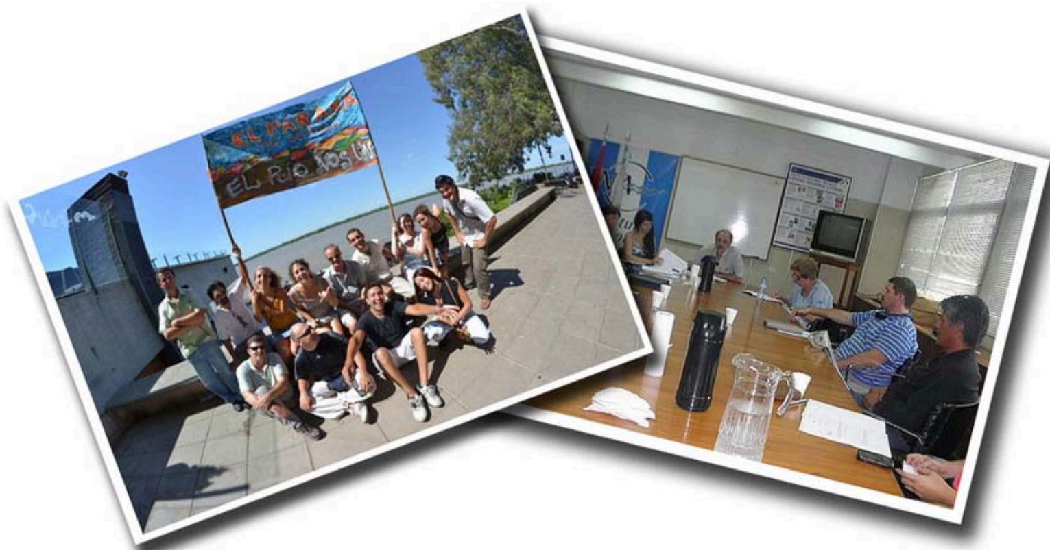
Izquierda: participación en ONG en defensa de los humedales del Paraná, 2012 Derecha: participación en el Concejo Provincial Pesquero de Santa Fe, 2013