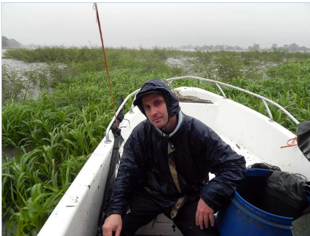
Al mal tiempo, mala cara”, Rio Paraguay, Formosa, febrero de 2012