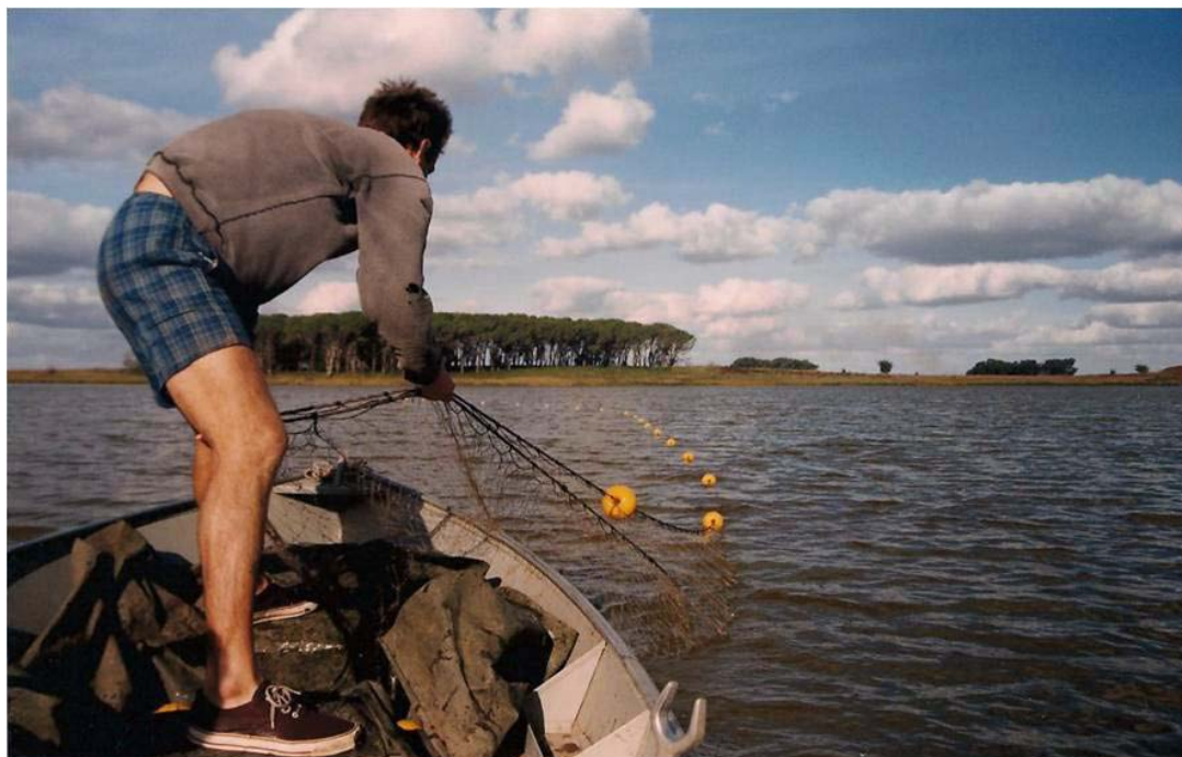
“Levantando enmalle”, Laguna de estudio experimental, Vedia, prov. De Bs. As., diciembre de 2000