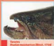
Surubí Mastomus maculatus (Bleeker, 1734)

a vida animal bajo el agua se asocia rápidamente con peces, y en la región pampeana en particular, con el pejerrey. Sin embargo, debajo del agua que cubre extensas superficies por toda esta región, habitan por cierto, un número mucho mayor de especies de peces.