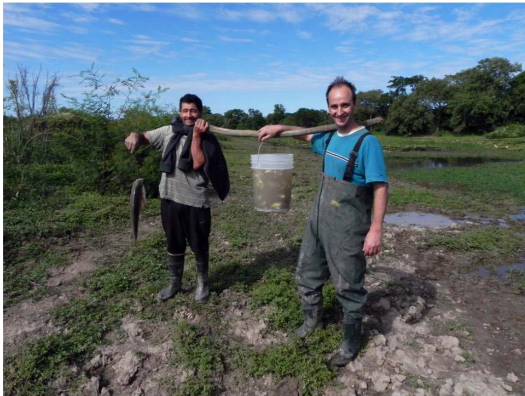
Buena pesca en la isla”, Entre Ríos, abril de 2011