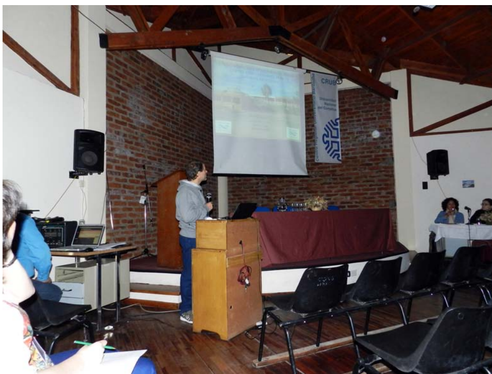
Presentando una de las colecciones en el XII Congreso de Herpetología , San Carlos de Bariloche, provincia de Río Negro, 2011