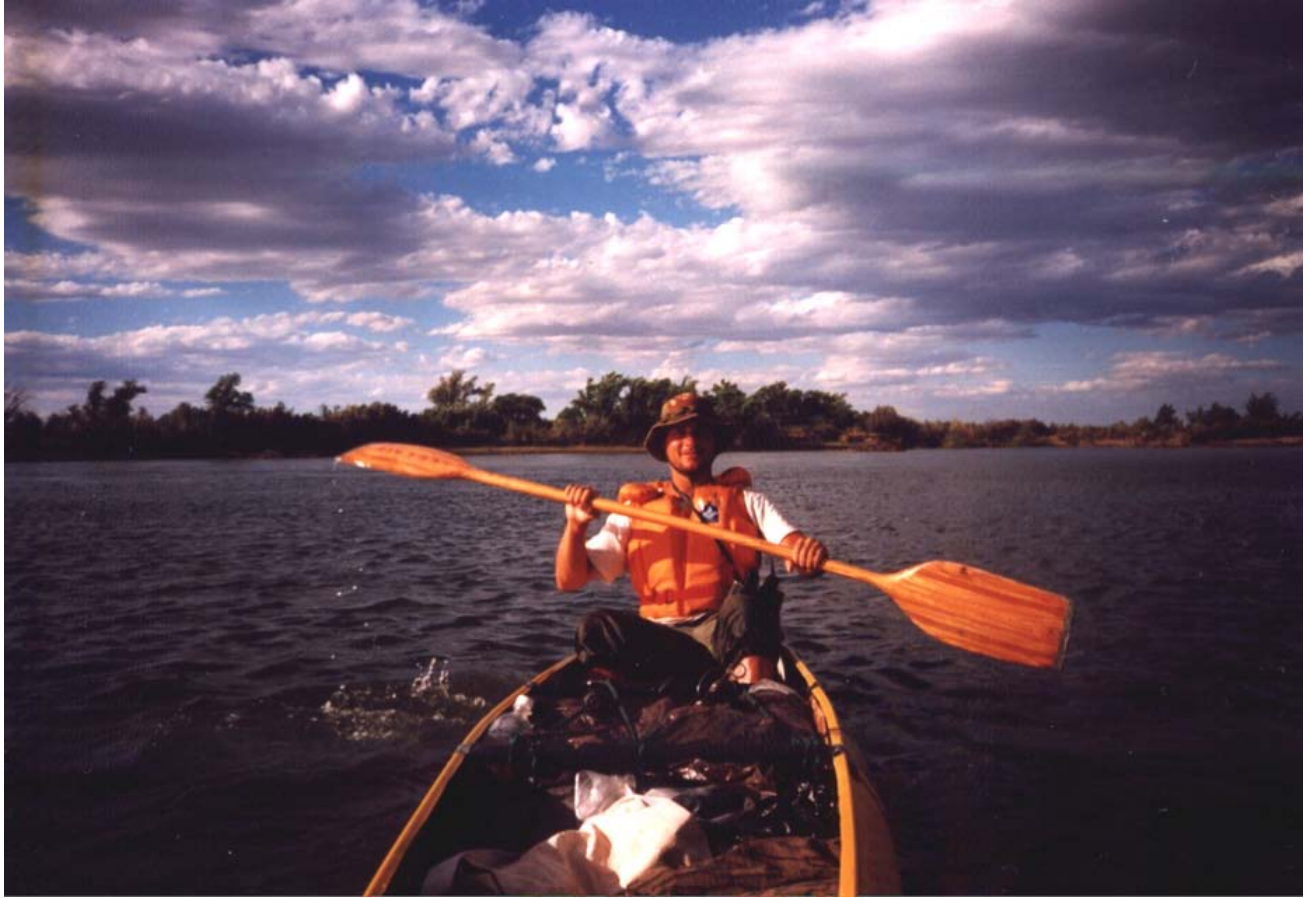
Bajada del río Negro, provincia de Río Negro, 2000