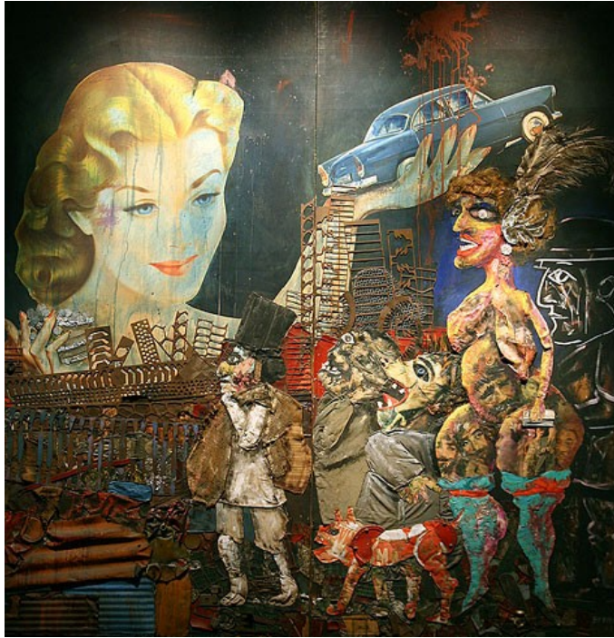
La gran tentación ó La gran ilusión 1962 Colección MALBA