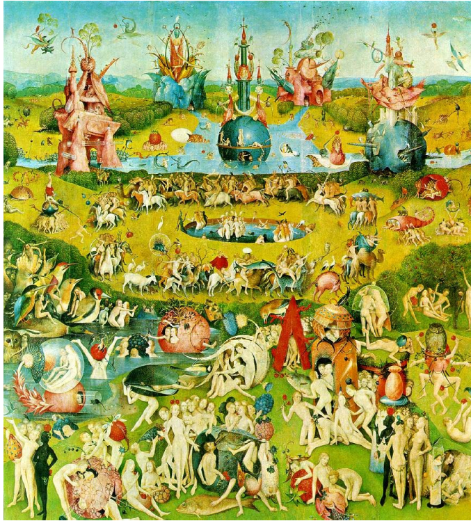
El jardín de las delicias (Panel central) Hacia 1500