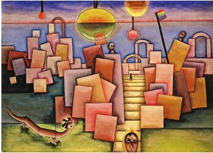
Rocas Lagui 1933

Artista inclasificable, único, que quizás en estos tiempos de fundamentalismos, puede pensarse como predicador del multiculturalismo y la convivencia de las diferencias.