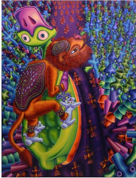
Proeza patoleónica hacia el deseo 2011

donde el espacio contenga al sujeto. Esta búsqueda incesante y utópica de catalogar desde el conocimiento, incita a la sensibilidad a despertar sus instintos perceptuales y disfrutar de la manumisión de la emoción. Estas obras son rapsodias de un todo indivisible; donde describo la “ecología afectiva” en el cual las circunstancias están conformadas por los vínculos unidos en una epifanía conceptual; protegidas y contenidas por un domo supremo: el amor. Éste como la forma más pura de comunicación.”