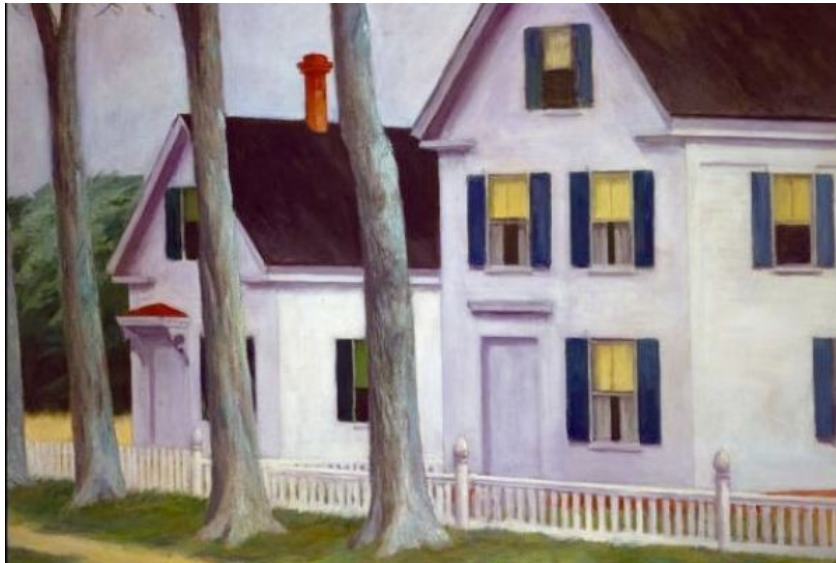
Dos puritanos 1945

buscar combinaciones de color, forma y diseño. El término “vida”, tal como lo entiende el arte, no es algo sin importancia, porque implica toda la existencia, y el arte debe reaccionar a ella, no evitarla. La pintura tendrá que ocuparse con mayor amplitud y valentía de la vida y los fenómenos naturales si quiere volver a ser algo grande.”