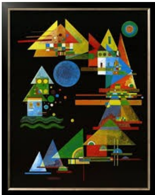
Arco y punta 1927