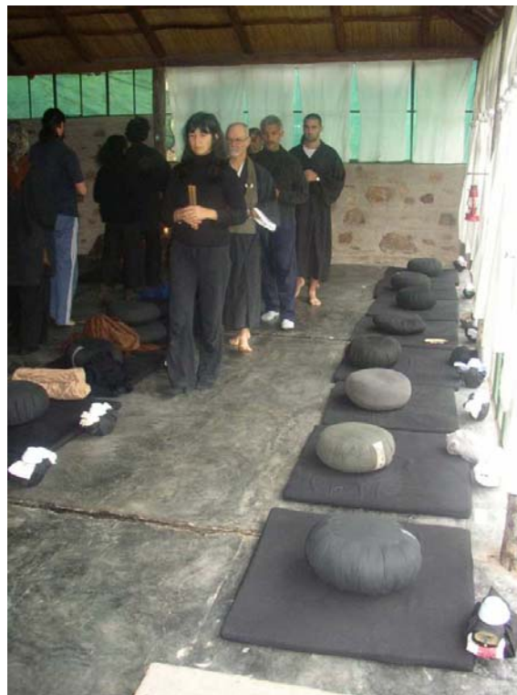
Ilustración 8. La meditación caminando ( kinhin ). Grupo Viento del Sur .