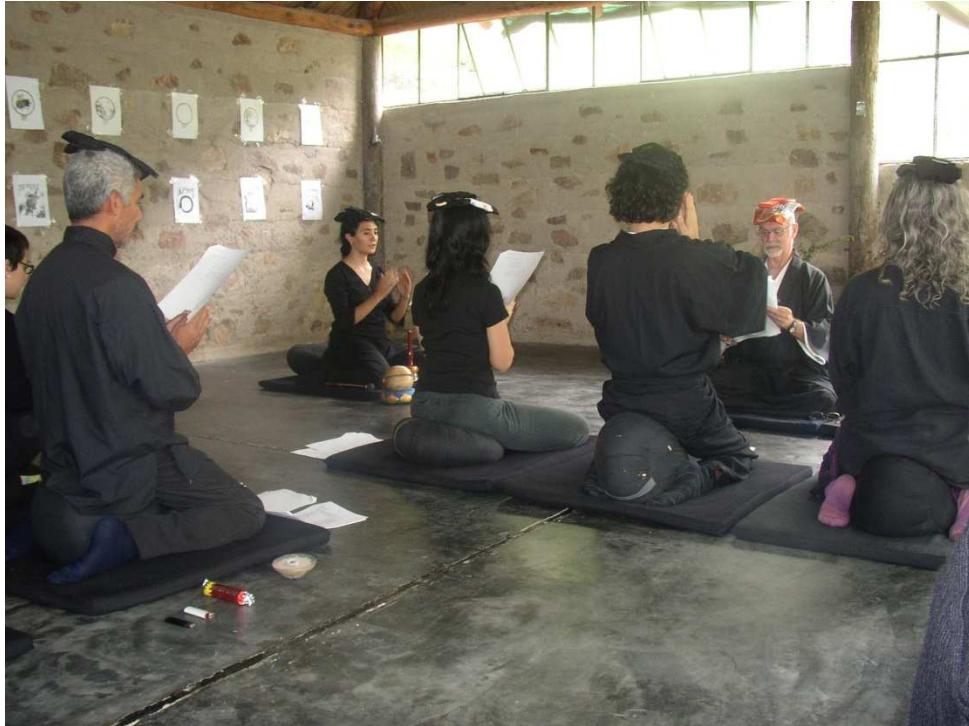
Ilustración 27. Jukai o toma de preceptos en Viento del Sur . Los discípulos recitan sutras con el rakusu sobre su cabeza.