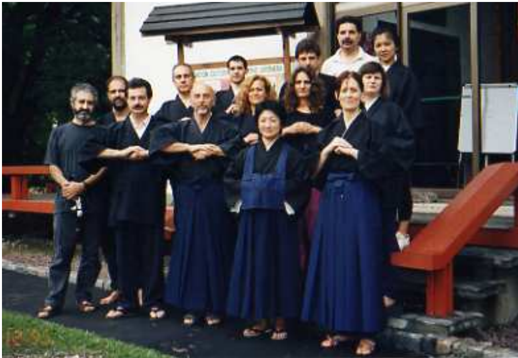
Ilustración 4. Sangha Zen del Sur, Nanzenji o Dojo del Jardín , en el año 1995.