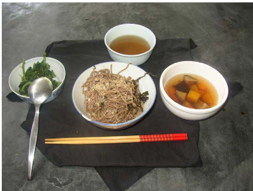
Ilustración 20. Orioki desplegado y servido, listo para comer tras recitar los sutras necesarios.