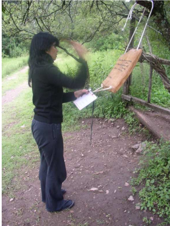
Ilustración 17. Llamada al zazen con la campana de madera en Viento del Sur .