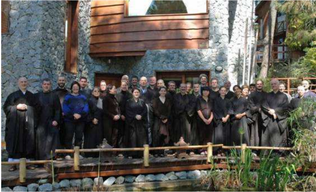
Ilustración 5. Sangha Ermita de Paja luego de una sesshin en el lugar que el grupo dispone en Mar de Las Pampas, Provincia de Buenos Aires, propiedad de uno de sus miembros.