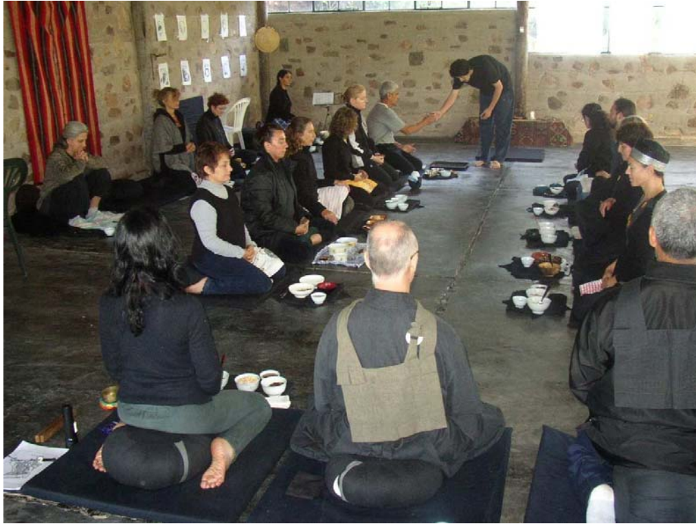
Ilustración 21. Comida ceremonial en Viento del Sur .