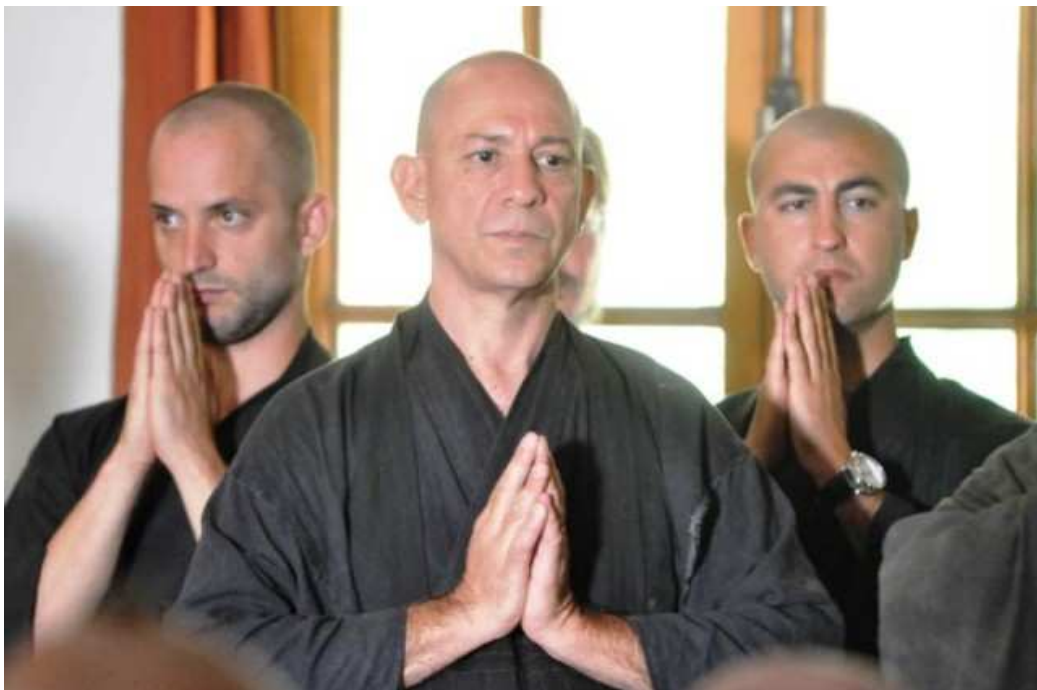
Ilustración 6. Monjes de la Sangha Kosen haciendo gasho .