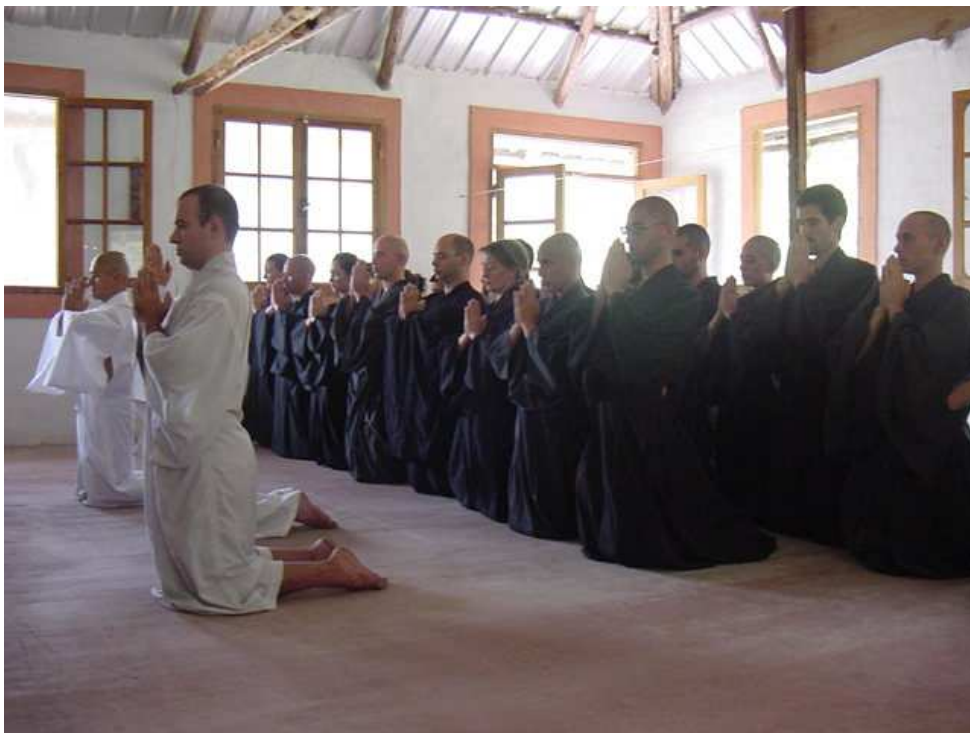
Ilustración 24. Discípulos esperando para las ordenaciones. Adelante tres candidatos a monjes vestidos sólo con el kimono blanco. Detrás, alrededor de quince futuros bodhisatvas .