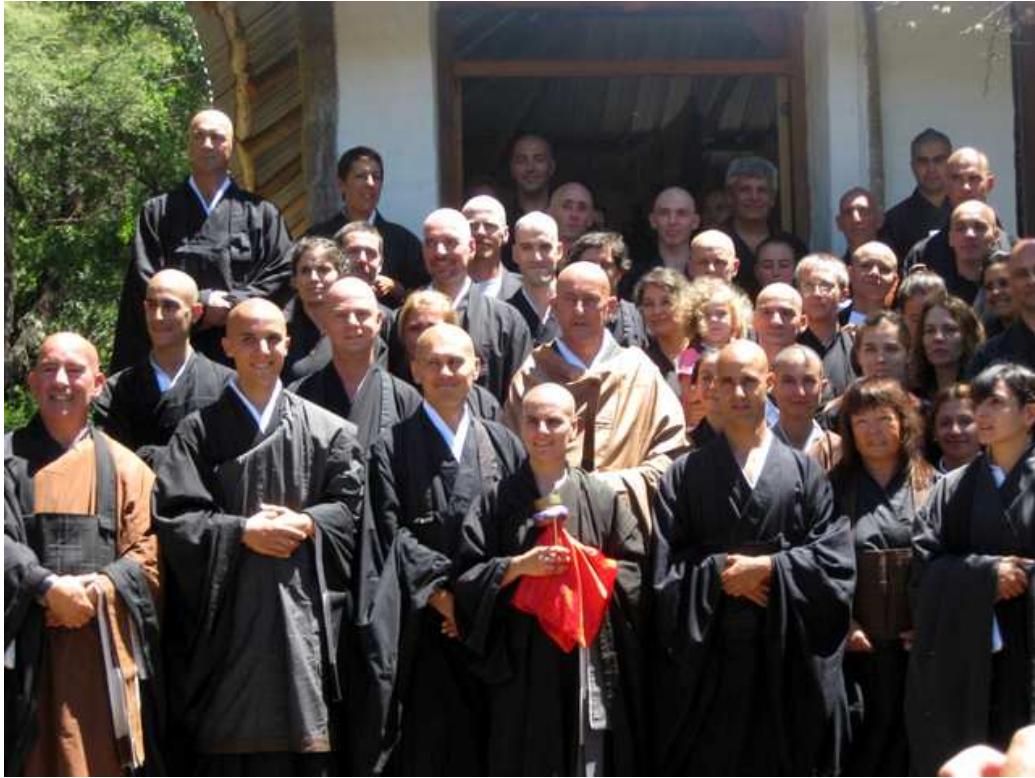
Ilustración 3. Foto de la Sangha Kosen luego de las ordenaciones, con el maestro en el centro vistiendo un kesa de color claro. En la primera fila se encuentra la “campanita”.