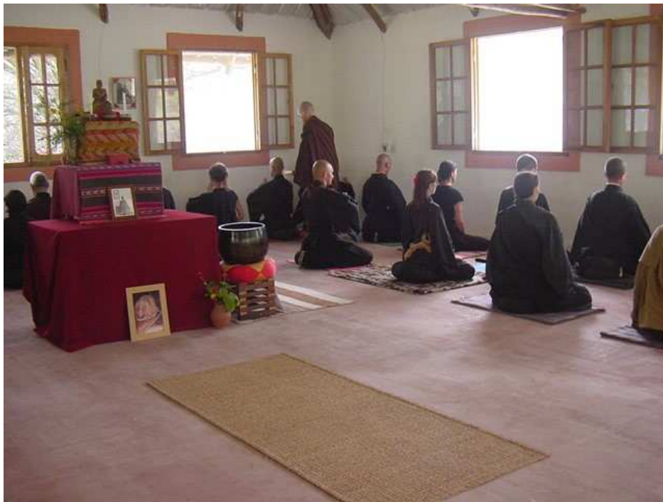
Ilustración 16. Interior del dojo de Shobogenji con practicantes en zazen .