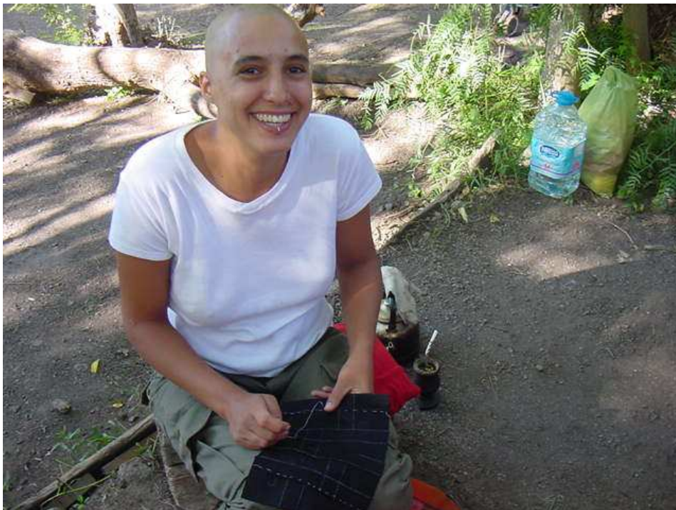
Ilustración 22. Cosiendo un rakusu en el Templo Shobogenji .