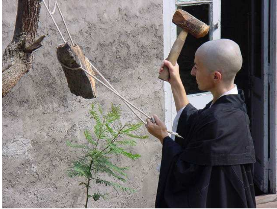
Ilustración 15. La campana de madera llama al zazen afuera del dojo de Shobogenji .