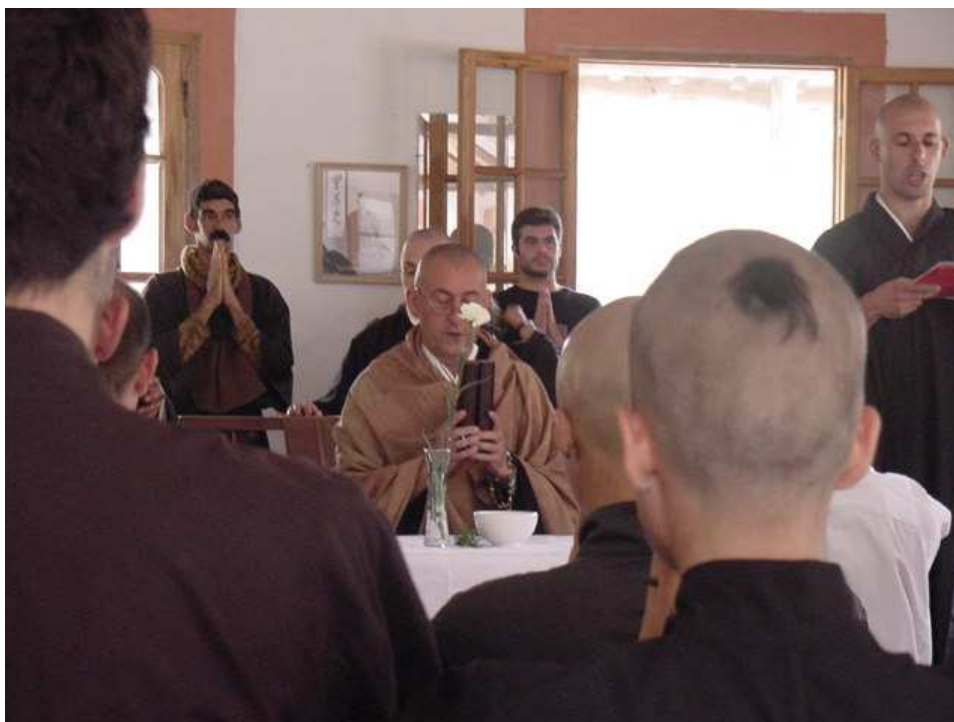
Ilustración 25. Maestro recitando los preceptos durante la ordenación.