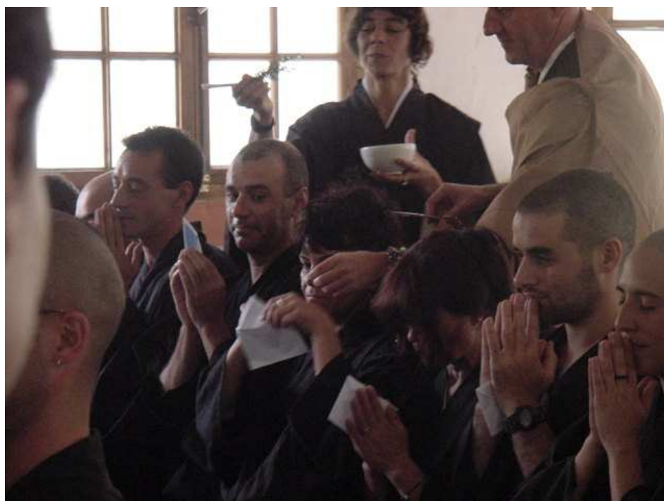
Ilustración 26. El maestro pasa por detras de cada bodhisatva y, luego que la secretaria rocíe la cabeza con una rama de pino embebida en agua, corta un mechón de pelo que deposita en un sobre.