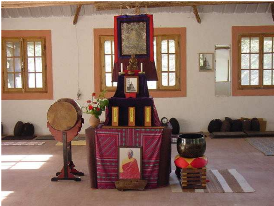
Ilustración 14. Interior del dojo de Shobogenji . En el altar se puede observar de abajo hacia arriba la foto del Sexto Patriarca chino, Eno (Hui Neng), el kyosaku , libros desplegados con sutras , flores, shoko , una foto de Deshimaru, velas y una figura del Buda. A la derecha, la gran campana del dojo , a la izquierda, el tambor.