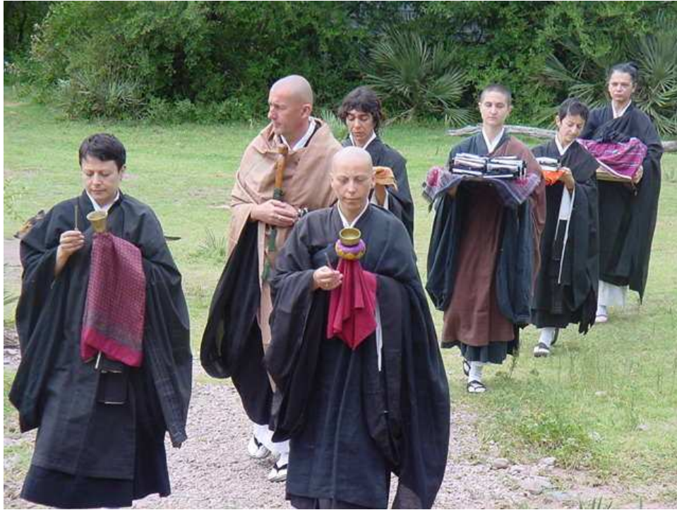
Ilustración 23. El maestro Thibaut (con un bastón pequeño, símbolo de su estatus) acercándose al dojo para las ordenaciones en Shobogenji . Al frente caminan dos “campanitas”, luego su secretaria, y detrás la encargada de la costura con dos ayudantes llevando los kesas y rakus para su consagración en la ceremonia.