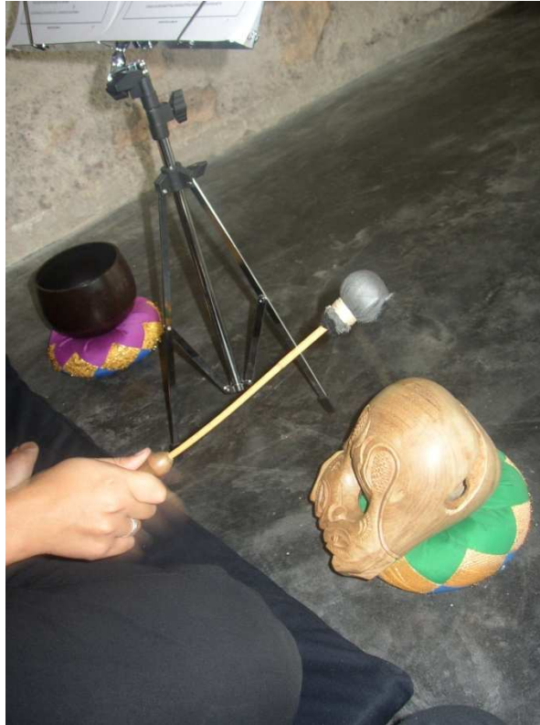
Ilustración 7. Encargada de las recitaciones de sutras del grupo Viento del Sur tocando el mokugyo . Atrás se puede ver la campana de metal.