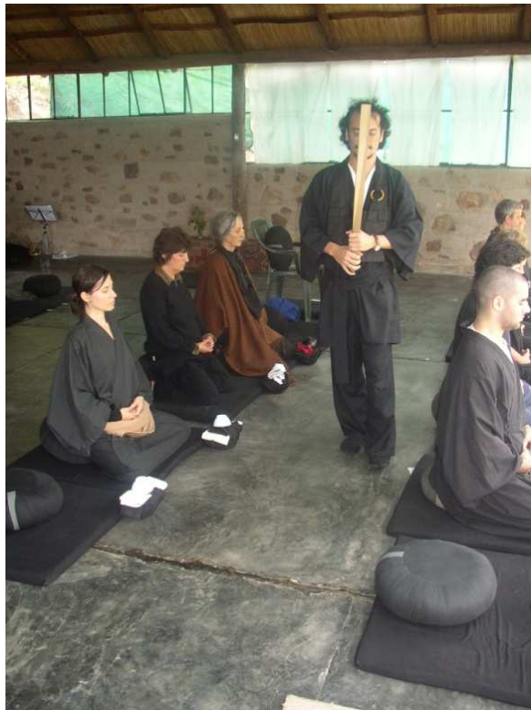
Ilustración18. Zazen en Viento del Sur en el dojo de Río Ceballos durante una sesshin . El tanto pasa con el kyosaku entre los meditadores aplicándolo a quien lo solicite.