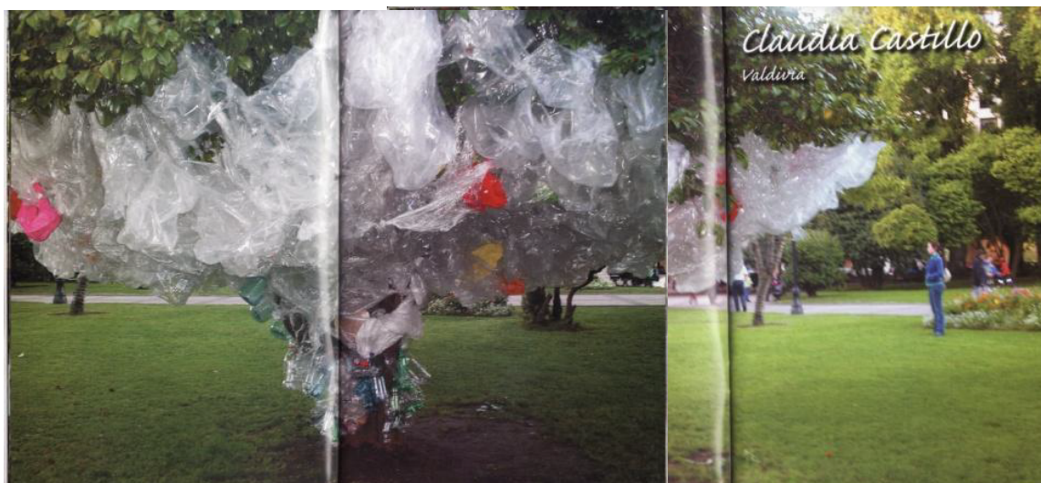
“Un Árbol, Un Artista”