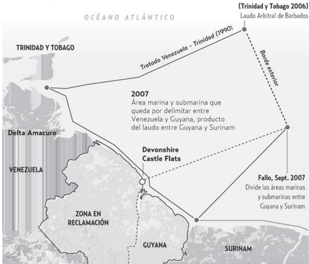
GRAFICA 3. FRONTERAS MARITIMAS VENEZUELA, GUYANA Y SURINAM.

Surinam argumentó ante un tribunal internacional en 2007 que no podía emplearse el punto Devonshire Castle Flats para calcular el límite marítimo con Guyana porque está en la zona que Venezuela reclama