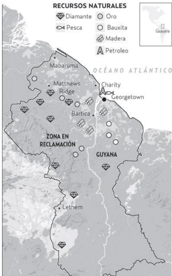
GRAFICA 2. RECURSOS NATURALES DE GUYANA