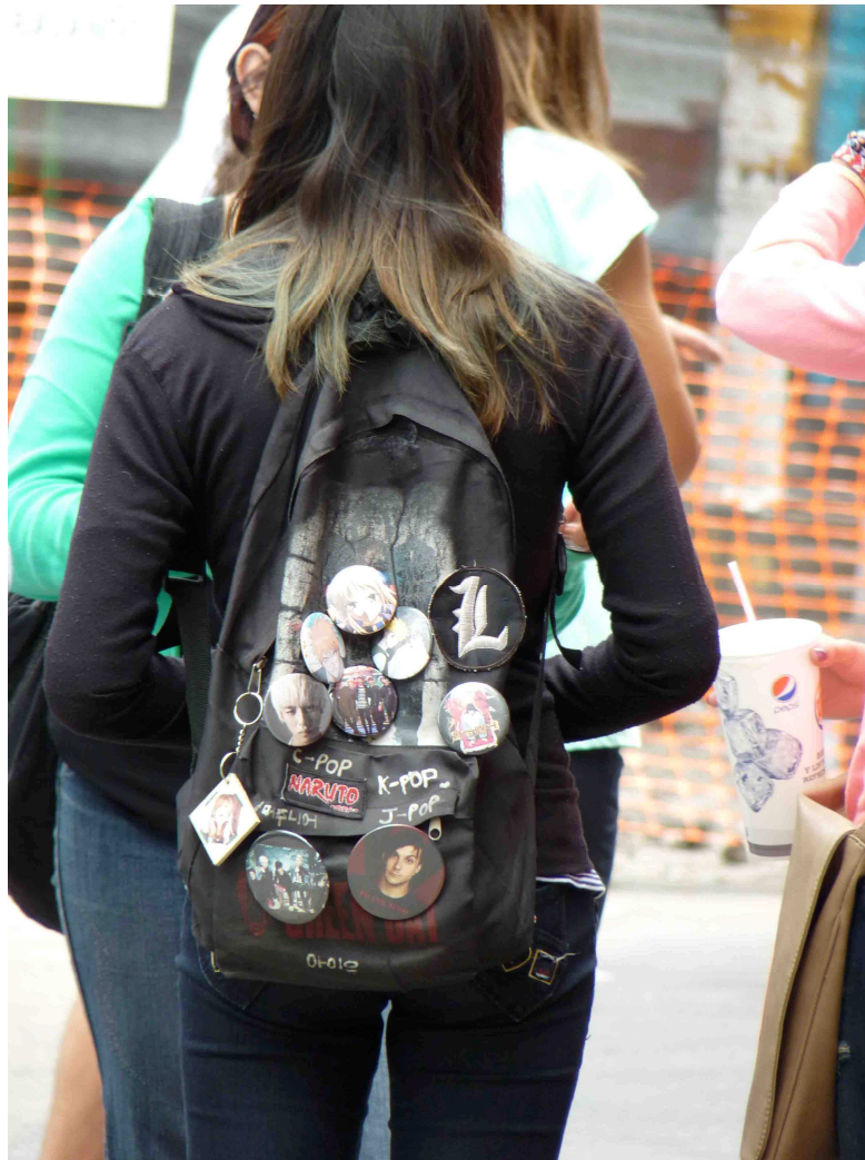
Fotografía 2: Merchandising fan-made en Barrancas de Belgrano, marzo de 2013, Molnar.

Incluso en Asia la propia industria se encargó de generar un sistema antipiratería: a fin de año se premian los discos más vendidos, lo que genera una verdadera “guerra de fans” a través del consumo para lograr que sus amados idols se queden en el podio. Con la compra de originales los fans club latinoamericanos también suman, y si de sumar granitos se trata otra de las acciones colectivas y de competencia a nivel mundial que realizan los k-popes es la de donar arroz para fines humanitarios en nombre de su artista favorito. Desde K-POP Argentina, explicaron: