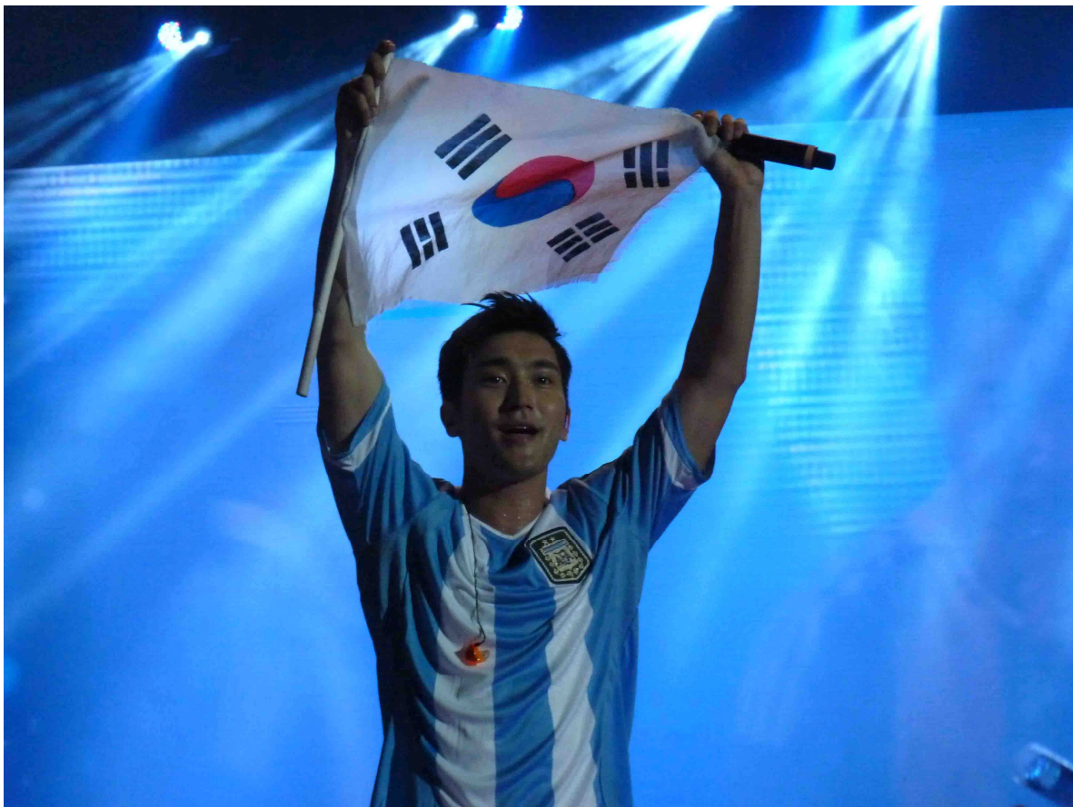
Fotografía 7: Emblemas e íconos nacionales en el Luna Park, 23 de abril de 2013, Molnar.

Las naciones, al igual que los Estados, constituyen una contingencia histórica y dentro de su problematización como construcciones socioculturales la nacionalidad fue entendida como una adhesión voluntaria más allá de los determinismos naturales que implican territorio, etnia, lengua o costumbres o bien como una herencia cultural que define un modo de ser particular. Gellner (1997) hasta la equiparó a “la membresía a un club”. La “comunidad imaginada” de k-popes es posible gracias a internet y a la mediación de las redes sociales en una expansión simultánea que ya generó tradiciones inventadas y hasta avizora la producción de otras nuevas. Una “comunidad imaginada” que empezó a anclar en América Latina donde aún sin ojos rasgados el ser fan significa heredar el ser foco de racismo; donde el propio nacionalismo (surcoreano) es el lenguaje elegido para hacer pie y revertir el discurso peyorativo y adverso y los k-popes crean estrategias para combatir ese rechazo racista. Considero queda pendiente y por tanto cabe dejar abierta la pregunta a futuros trabajos –que se realicen en mayor profundidad etnográfica, con estancias más prolongadas y de forma multilocal– sobre qué categoría le cabe a estas nuevas identidades que forjan fenómenos transnacionales como el K-POP. Esas que partiendo de una industria cultural desarrollada en un