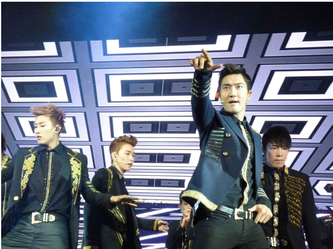
Fotografía 1: Luna Park K-POP. Super Junior fue la primera banda surcoreana en hacer un show en la Argentina, 23 de abril de 2013, Molnar.

Nacido a principios de la década de 1990, el K-POP es la música popular moderna de Corea del Sur que incluye un mix entre el hip hop, la música electrónica y otros géneros occidentales e incluso restos del propio folklore musical coreano (Hanguk Eumak). Dentro del K-POP hay grupos conformados solamente por varones, “boybands”, otros solamente por mujeres, “girlbands”, y cantantes solistas. Todos los miembros de estos grupos son denominados “idols” por los fans. Con letras en las que el Hangul (idioma coreano) se mezcla casi siempre con palabras en inglés y en contadas ocasiones con otros idiomas occidentales, incluido el español, la vestimenta es llamativa y los videos poseen un abarrotamiento pulcro y tecno de luces, baile y erotismo recatado. Todo para un “visual shock” que, según describen sus seguidores, es “exactamente igual en las presentaciones en vivo” (Molnar, 2013).