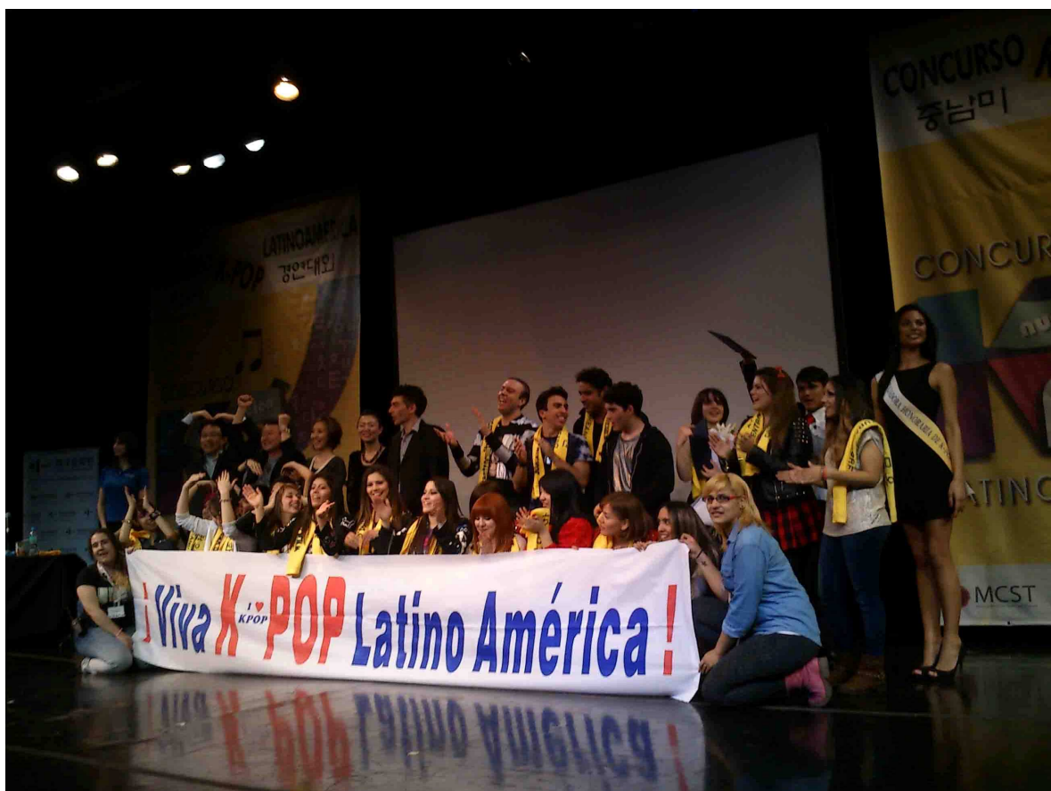
Fotografía 6: ¡Viva el K-POP Latinoamérica!, 31 de agosto de 2013, Molnar.

En el concurso latinoamericano 2013 se presentaron trece finalistas de siete países y con el varios medios de prensa locales e internacionales comenzaron a hacer informes “positivos” sobre la “nueva ola coreana” y sus fans, quienes no se cansaron de agitar unos “towel” amarillos, un típico objeto de marketing que, en general, llevan en nombre de los grupos, pero en este caso promocionaban al CCC en Español y en Hangul.