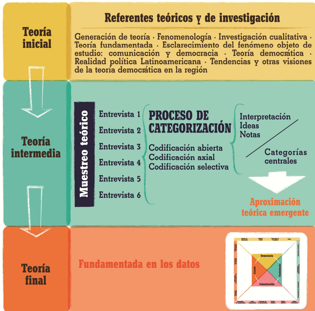
Figura 1: Proceso de generación teórica, 2012, María Colina.

iniciales sobre la teoría democrática y la comunicación. Igualmente aspectos relacionados con el enfoque metodológico.