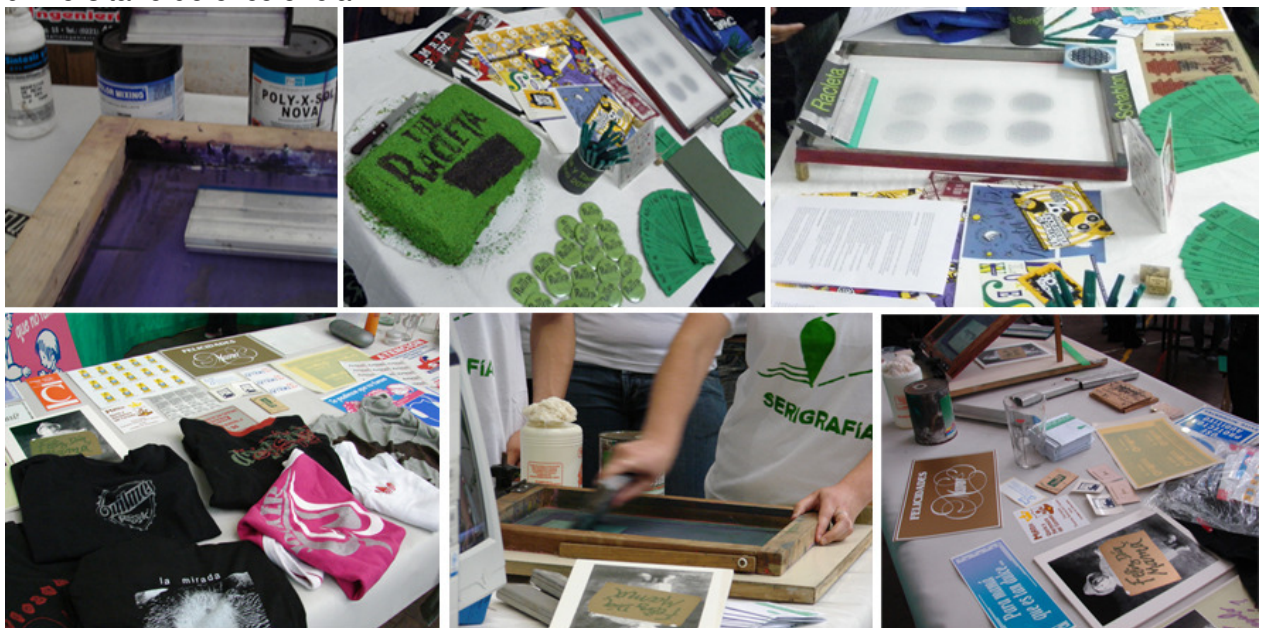
Figura 1. Ejemplos de clases: una demostración práctica, reconocimiento de impresos

En el aula los alumnos realizan relevamientos de piezas impresas, analizando y develando los procesos productivos, históricos, tradicionales, industriales y digitales. Para alcanzar los saberes específicos de la tecnología del sistema de impresión serigráfico, y una vez estudiados, aprendidos, internalizados estos conocimientos lograr desarrollarse en el campo laboral con mayor eficacia, como un profesional universitario de excelencia.