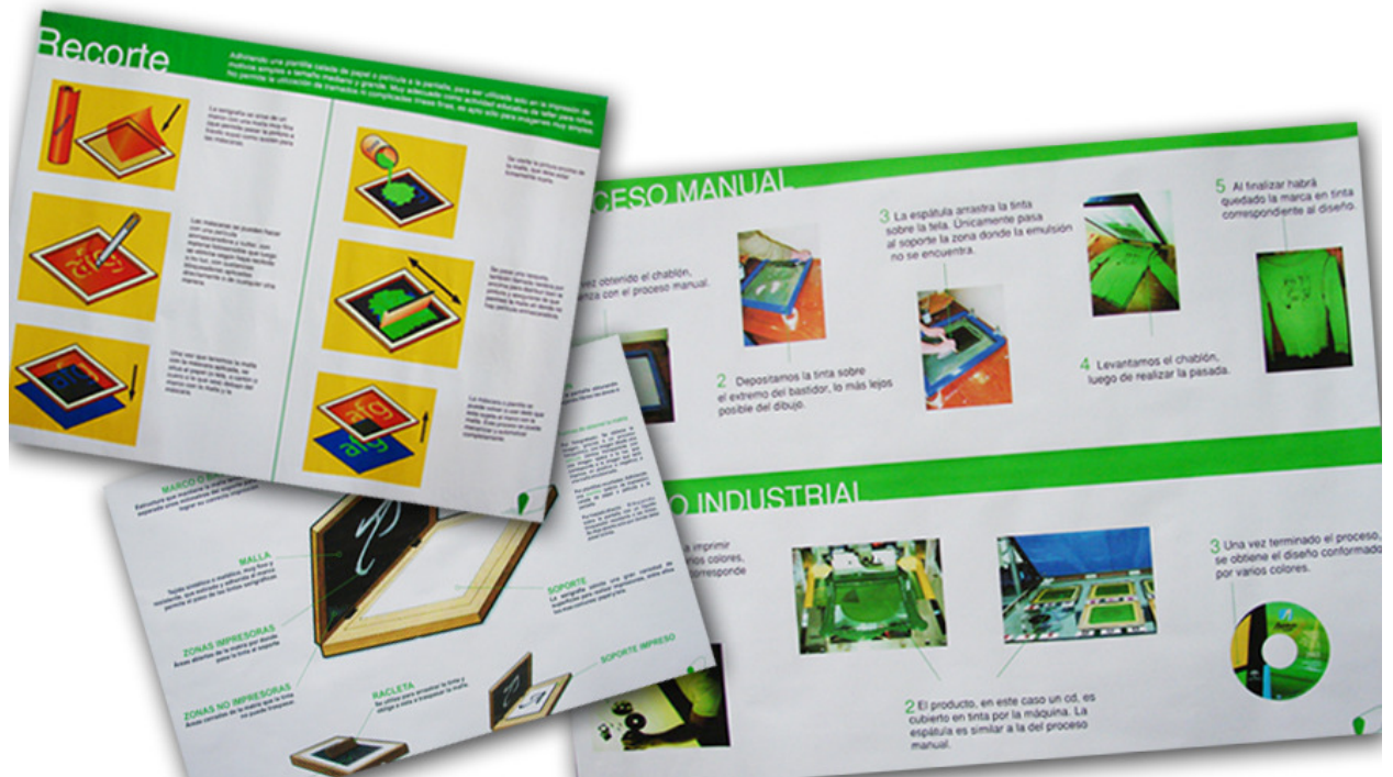
Figura 4. Infografías y paneles con gráficos esquematizando el sistema serigráfico

Estos conocimientos especiales basados en principios y metodologías de procesos productivos, tanto de dominio práctico como de fundamento teórico, deben ser enfocados al trabajo específico de la puesta en práctica de la enseñanza / aprendizaje de la tecnología de diseño en comunicación visual. Tanto en el espacio aúlico como en las áreas de producción industrializadas Así lograr que nuestros alumnos piensen, actúen y se desempeñen como futuros profesionales universitarios de excelencia.