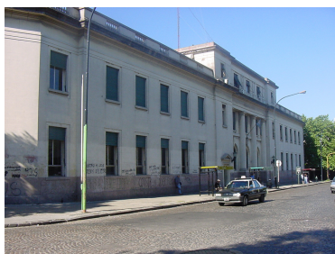
Imagen 2 – Biblioteca Pública de la UNLP. Fachada sobre Plaza Rocha. Proyecto, Arq. Alberto Belgrano Blanco, 1925

La década del '20 finaliza, en el ámbito universitario, con la presidencia de Ramón Loyarte (1927-1930) quien pretende dar preponderancia a las disciplinas profesionalistas sin interrumpir la orientación humanística vigente. Dado su procedencia desde las ciencias duras y el interés por la cultura general y artística, el llamado "físico esteta" inserta a la UNLP en destacados ámbitos culturales 16 .