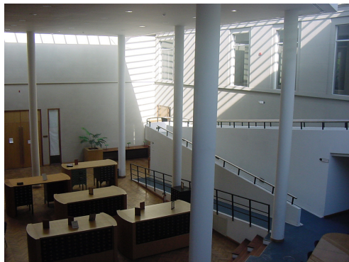
Imagen 4 – Hall central con ficheros y rampa

Situación edilicia actual tras la intervención