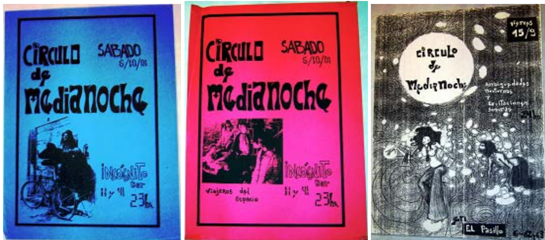
12. Afiches para la difusión de los eventos en distintos lugares de La Plata