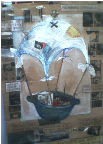
8. Dibujos para escenografías