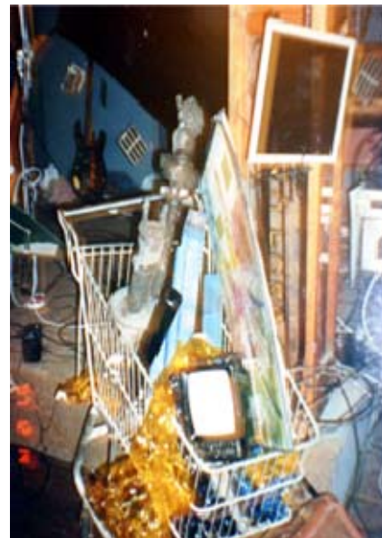
5. Carritos para el consumo

Con el grupo soporte se nos ocurrió la idea de hacer el recital por el caos que derivó en el Protochaos, el primer caos, el caos creativo, el caos que apela a nuestra creatividad.