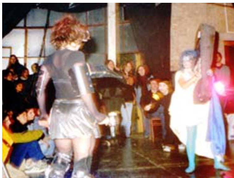
11. Imágenes de sus presentaciones

La propuesta era que tocaran su música acompañando imágenes preelaboradas. En la presentación había una bailarina, se recitaban poemas y el grupo trabajó musicalmente esas imágenes para después exponerlas al público.