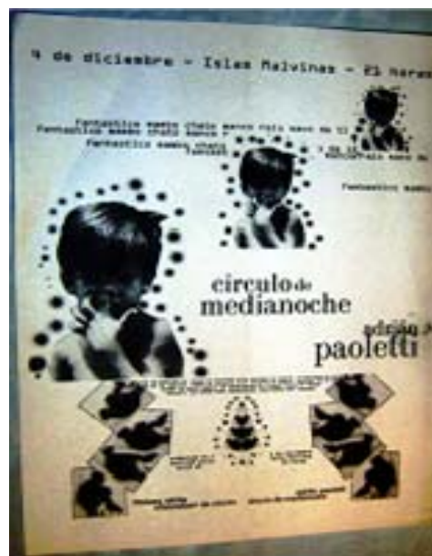
9. Afiche presentación en Malvinas