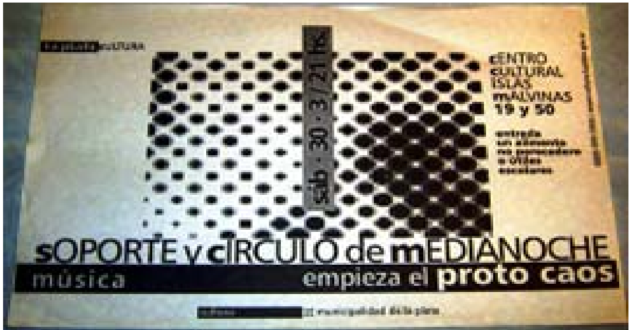
3. El Protochaos Performance, realizada en el Centro Cultural Islas Malvinas a fines del 2002.

El recital del Protochaos, fue según Simón como una contestación a la política a Duhalde. En respuesta de la crisis que se vivía en aquel entonces. En un momento político en que el presidente dijo: O soy yo o es el caos, y todos dijimos, no vamos al caos por favor. Comenta Simón.