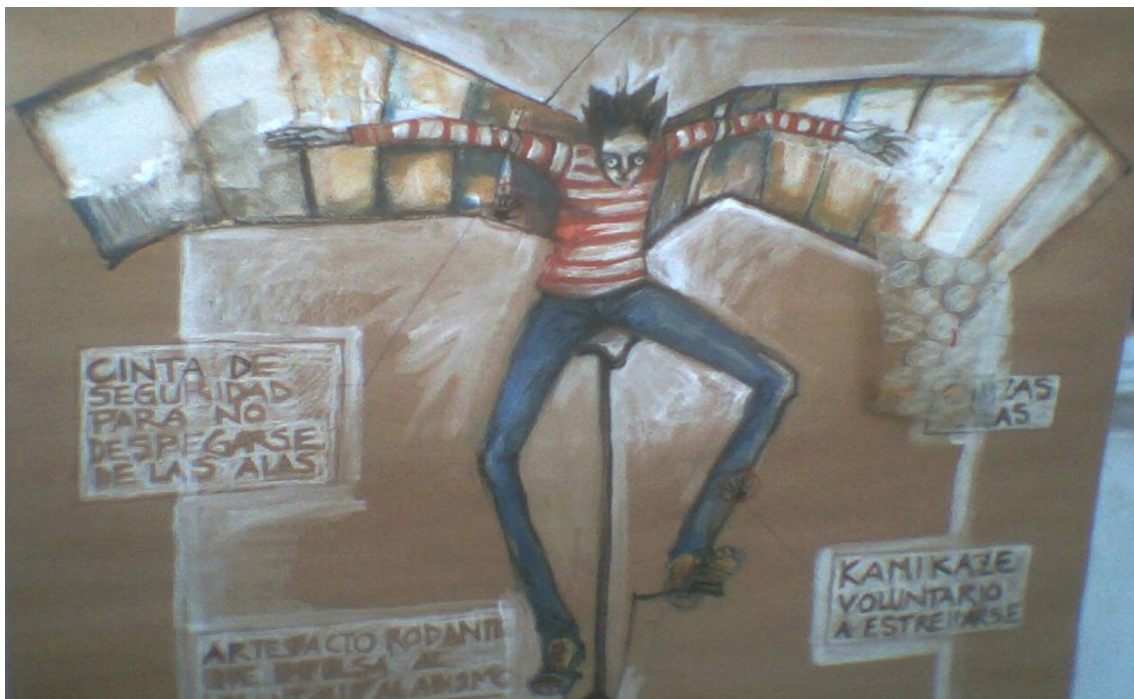
7. Bocetos para escenografías

Ensayamos unos tres temas juntos y diagramamos el recital. Para favorecer la idea, se armaron dos escenarios diferentes. En una planta rectangular del salón mas grande que tenía el Malvinas, con un escenario en cada punta. La escenografía se iba a ir construyendo a medida que iba sucediendo el recital. Los tres temas ensayados era uno al principio otro al final y otro en el medio. Estaba lleno de gente, empezó el grupo Soporte a tocar y veías a toda la gente que no sabia donde ubicarse y al toque atrás de ellos empezó a sonar Círculo, el mismo tema, el público iba y venía, se paraba en el medio, entre sillas