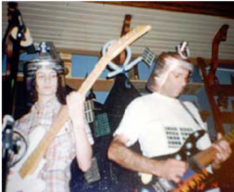
6. Músicos usando gorros y sombreros hechos con botellones