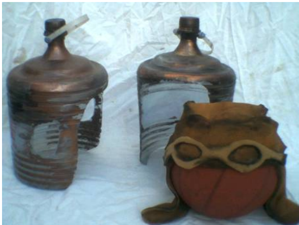
4. Gorras, sombreros y máscaras para los músicos

El recital del Protochaos, fue según Simón como una contestación a la política a Duhalde. En respuesta de la crisis que se vivía en aquel entonces. En un momento político en que el presidente dijo: O soy yo o es el caos, y todos dijimos, no vamos al caos por favor. Comenta Simón.