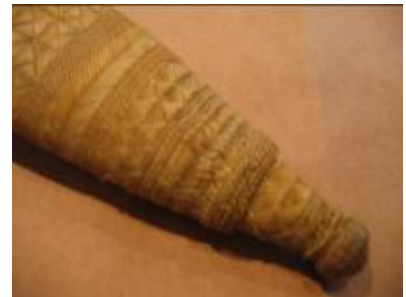
Cabo y vaina de cuchillo (detalles)