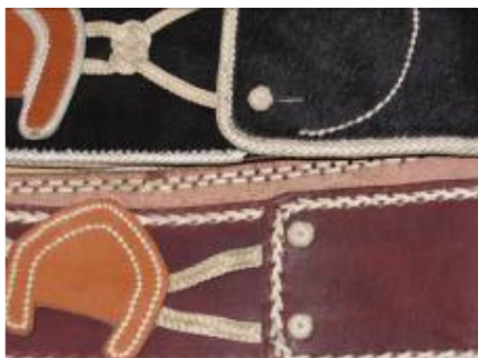
Rastra o tirador

En un recorrido entre artesanos se han podido algunas muestras de tipologías de productos utilitarios, éstas responden a regiones diversas del país, en las que costumbres, recursos materiales, y básicamente antecedentes culturales, han incidido en sus características particulares.