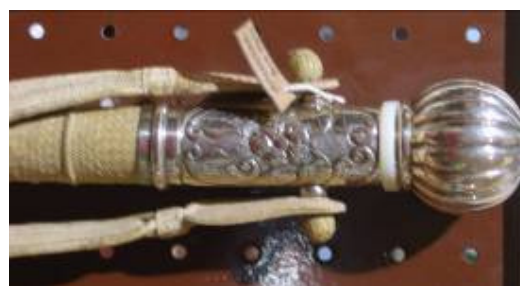
Rebenque con remate de plata