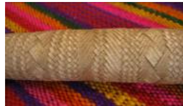
Cabo de cuchillo