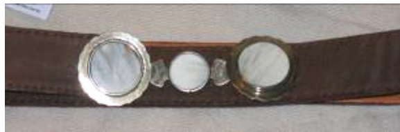
Cinturón con aplicaciones de metal (plata)