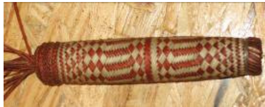
Cabo de cuchillo (dos tonos)