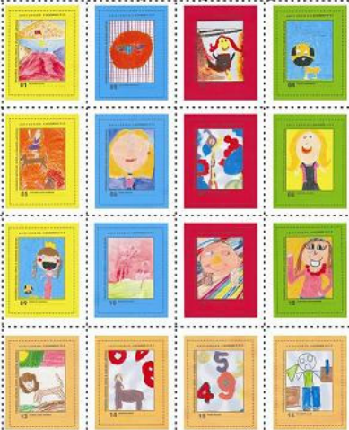
Serie de Estampillas realizada por el Taller Pequeños Artistas junto a Grandes Maestros de Puerto Madryn, Patagonia Argentina.