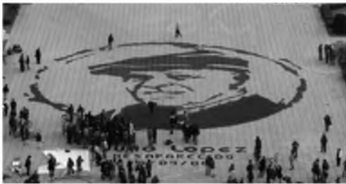
Figura 3. Colectivo Sienvolando: efigie de Julio López en Plaza Moreno. La Plata, 2008

En la marcha del 18 marzo de 2007, el Colectivo Siempre apeló a recursos tanto plásticos como musicales, instauró el uso de la pancarta circular con el rostro de López con una gorra, trabajado con la técnica del estencil en color rojo sobre blanco y negro y también plasmaron los signos de interrogación en pancartas con el mismo formato [Figura 2]. A su vez, en junio de 2008, el Colectivo Sienvolando realizó una performance en el centro de la Plaza Moreno de La Plata con idéntico motivo en formato monumental, que se erigió en un índice de la inacción de la justicia y testigo de una época nefasta [Figura 3].