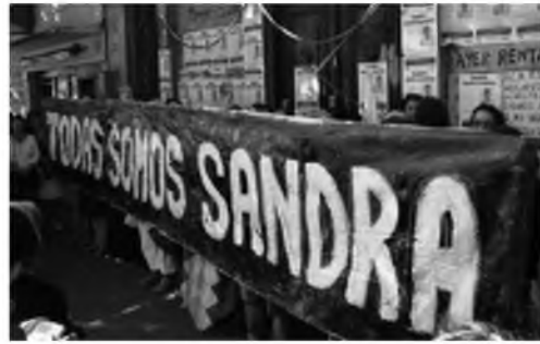
Figura 5. Colectivo Siempre: Todos somos Sandra.

Estas iniciativas colectivas, entre otras que exceden el espacio del presente artículo, 15 tienen en común reformular el estatuto de lo artístico, alterar las formas de representación y relacionarse con los movimientos políticos proponien-