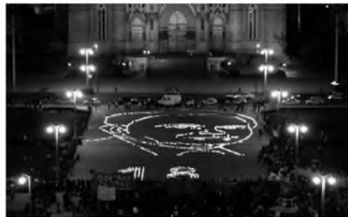
Figura 4. Jorge Pujol: efigie de Julio López con velas en Plaza Moreno. La Plata, 2008

Estos recursos plásticos y visuales proliferan en reclamos desarrollados en el espacio público de las ciudades más importantes del país. Remiten, indudablemente, a instaurar desde la imagen completa de Julio López, la efigie sintetizada, el signo de interrogación, el rostro con cintas adhesivas sobre la boca aludiendo al silencio, una denuncia a la impunidad y un sostén de la memoria. En el caso de las velas encendidas funcionaron como metáfora de la luz de esperanza en la búsqueda de justicia y en la forma de mantener viva la presencia. Si bien el recurso es simple, sintetiza significaciones imaginarias muy fuertes en el seno de la sociedad. Un artículo firmado por Chempes da cuenta de todas las acciones que incluyen las diferentes utilidades de la efigie, las intervenciones y los grafitis del caso Julio López. El texto fue publicado en Indymedia, 12 centro de información que tiene como premisa la libre difusión de noticias ausentes en los medios masivos tradicionales, para lo cual una cantidad importante de datos sobre movilizaciones, marchas y acciones estudiantiles están incluidas en esta página de la web y añaden múltiples aspectos que exceden a las consideraciones de este artículo.