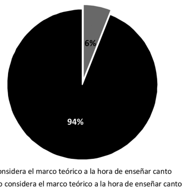
Gráfico 2. Consideración del marco teórico de la pvc a la hora de enseñar canto

El procesamiento de los resultados parciales permitió analizar en qué medida el paradigma de la Pedagogía Vocal Contem-