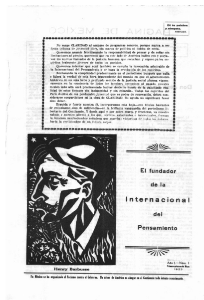
Figura 2. Primera página de Claridad N.º 1 (1923)

El arte clásico convivió con la contestataria editorial. En el retiro de tapa del primer número se expresó: “Claridad no tiene subvenciones. Su vida depende del aliento de los hombres libres. Hagamos la Revolución en los espíritus”. Acompañó dicha página un grabado en plenos planos, que hacía alusión a la figura de Henry Barbusse, con un rótulo que agregaba: “El fundador de la Internacional del pen-