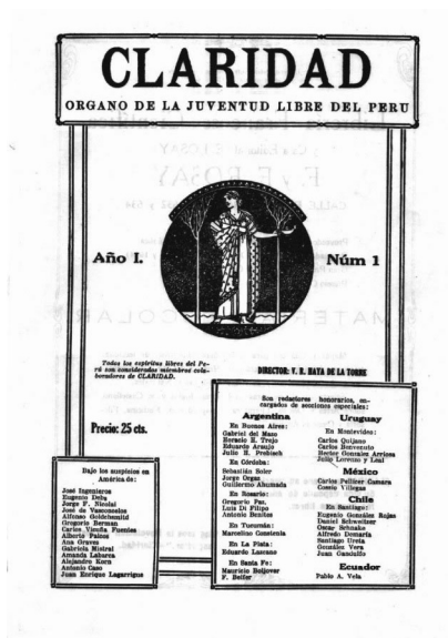
Figura 1. Tapa de la revista Claridad N.º1 (1923)

emergencia de estas primeras vanguardias— en una acelerada sucesión de manifiestos, exposiciones y polémicas”. Y agrega: “Se nota la intención de marcar no sólo lo novedoso, lo ‘moderno’, sino también lo nacional [...] intención que se ve concretada tanto en la plástica y en la música, como en la literatura que incluye en la vanguardia importantes tendencias regionalistas” (Hitz, 2008).