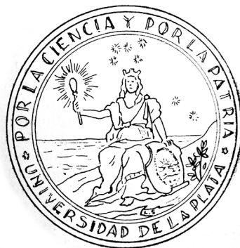
Figura 2. Escudo de la Universidad Provincial realizado en 1897

[...] es una representación puramente figurativa. Y las más de las veces se trata de una personificación expresiva de concep-