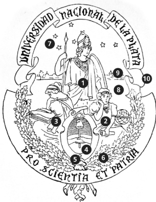
Figura 5. Referencias iconográficas del escudo o sello mayor actual

figura reemplazó a la alegoría de la ciudad de La Plata que se veía en el escudo de Universidad Provincial.