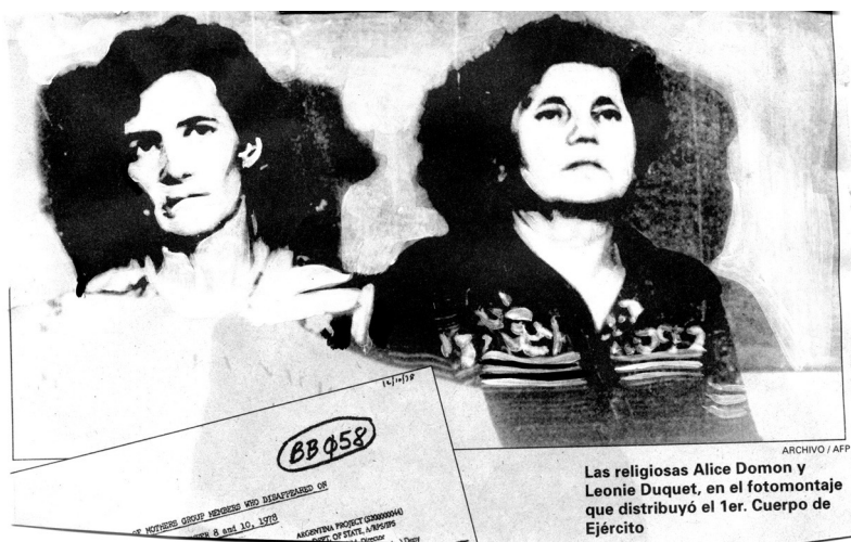
Figura 2. Fotografía de archivo tomada en el Ex Centro Clandestino de Detención de la ESMA (1977)

Para ensayar una respuesta a esta cuestión, cabe mencionar la definición que Jacques Aumont hace del dispositivo. El autor lo define como “un conjunto de determinaciones que engloban e influyen en toda relación con las imágenes”, entre las que se encuentran “los medios y técnicas de producción de las imágenes, su modo de circulación y reproducción, los lugares de accesibilidad y los soportes que sirven para difundirlas” (Aumont, 1992). En estos términos, reducir el campo de la indumentaria a una de estas dimensiones (el soporte) sería perder de vista la compleja relación que se establece entre las producciones que cruzan indumentaria e imagen impresa.