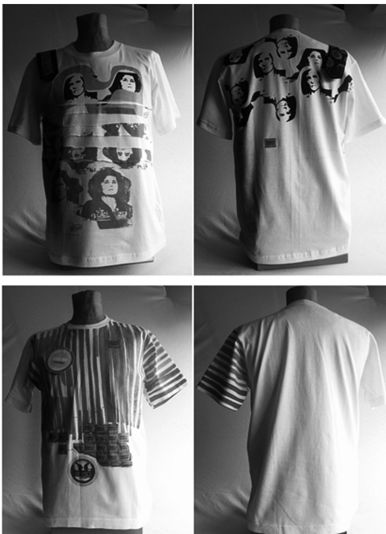
Figura 1. Remeras estampadas realizadas en el marco de la investigación “Sobre la superficie la piel” (2004)

La Bauhaus fue, en ese período, un espacio de discusión por el que transitaron no-