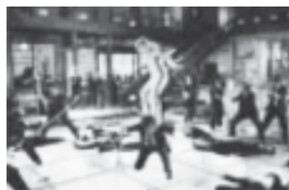
Kill Bill 1 , Quentin Tarantino, 2003.

dagogía tradicional, tan proclive a situarse en un estadio superior al de las disciplinas artísticas, ha contribuido poco. Cuando se habla, también desde lugares comunes, de la significatividad de los aprendizajes, la formulación de objetivos y contenidos con frases del tipo "qué, cómo y cuándo aprender" y otras por el estilo, cabría preguntarse si una búsqueda realizada desde la propia dinámica de los lenguajes artísticos no sería capaz de realizar aportes acaso verdaderamente significativos, más allá de sus enunciados, en el aula. ■