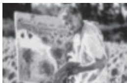
Vincent y Theo , de Robert Altman, 1990.

artistas favoritos para el cine, por ejemplo en Vincent y Theo , de Robert Altman. 5 Encarna la vida bohemia, desordenada; propenso al alcoholismo (desesperado, llega a beber el diluyente de sus óleos) y otras adicciones; genera vínculos enfermizos con familiares y amigos (la relación con su hermano Theo y con su amigo Gauguin, que desencadena en el siempre fascinante episodio de la oreja). Emblema del estereotipo del artista loco, Van Gogh padece serios trastornos psicológicos: depresivo, irascible, violento, inconforme: desórdenes de la conducta que lo empujan al suicidio. 6