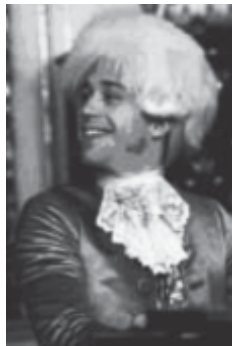
Amadeus , Milos Forman, 1984.

instrumento a un jactancioso, lujurioso, obsceno muchacho infantil y a mí me premias sólo con habilidad de reconocer la encarnación. Porque tú eres injusto, desleal, duro, te detendré. Lo juro. Le estorbaré y perjudicaré a tu criatura en la tierra tanto como pueda. Arruinaré tu encarnación”. Luego, arroja el crucifijo a las brasas.