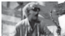
Dr. Emmet Brown interpretado por Christopher Lloyd en Volver al futuro , Robert Zemeckis, 1985.

El empleo del sono y de la música en el cine refuerza los estereotipos visuales: notas agudas puntuales en un marco atonal para la escena de la nenita que juega en su habitación despreocupada del acecho inminente del asesino serial. Notas graves para alertar (al espectador, no a la nenita) sobre la presencia de semejante monstruo. Notas largas producidas por un sintetizador, interrumpidas ligeramente por tres o cuatro sonidos percutidos graves para escenas de alienígenas o seres espaciales desconocidos (que, por cierto, suelen ser verdes, de grandes cabezas...). Ascensos por semitono que indican mayor tensión y repiqueteos en música "con mucho ritmo" para la inefable e infaltable persecución automovilística de toda película de acción que se precie de tal.