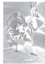
Menor alta: delicadeza, sutileza, atmosférico. Temas poéticos.