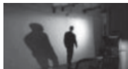
Pollock , Ed Harris, 2000.

Pollock , dirigida y protagonizada por Ed Harris, resulta un compendio de los lugares comunes referidos al artista. Basada en la biografía de Jackson Pollock, famoso pintor representativo del action painting , esta película construye el perfecto retrato del artista atormentado. Alcohólico y depresivo, sus rasgos de inadaptable hacen que llegue tarde y borracho a una cita con la famosa coleccionista y galerista Peggy Guggenheim. Pero él es "un genio". Hasta la malhumorada y caprichosa Peggy es capaz de soportar ese desplante y que, en su propia casa y ante numerosos invitados, Pollock orine sobre su hogar de leños ardientes. Los artistas son excéntricos. Pasa días acurrucado en un rincón mirando la tela en blanco, pese a la desesperación de su pareja, a quien le cierra la puerta en la cara. Hasta que un día, sin que medie trabajo previo, boceto o algo por el estilo, Jackson arremete con energía su tarea y no sólo comienza sino que termina en único aliento su obra maravillosa. Le había llegado la inspiración. 4