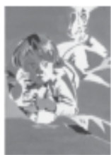
Mayor intermedia: gran equilibrio, sobriedad.