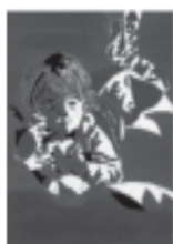
Mayor baja: dramatismo, solemnidad, profundidad, misterio.