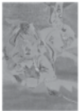
Menor intermedia: gran equilibrio, elegancia, suavidad.