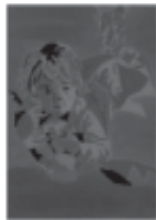
Menor baja: misterio, pobreza, melancolia.