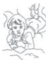
Línea blanda ondulante.