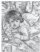
Imagen de punto de partida.