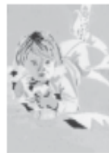
Mayor alta: dramatismo, vitalidad, exuberancia.