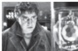
Dr. Octavius interpretado por Alfred Molina en El hombre araña 2 , Sam Raimi, 2004.