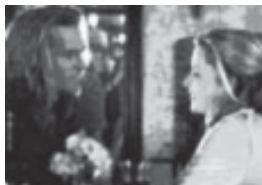
El Santo , Phillip Noyce, 1997.

cuales el personaje –así tenga que decir sólo “La mesa está servida”– imposta la voz remedando a Alfredo Alcón en Hamlet y, en los casos extremos, despeina su pelo oscuro a lo Montecristo. Esta construcción aparece, por ejemplo, en El Santo , de Phillip Noyce. Aquí, Val Kilmer encarna al camaleónico ladrón internacional Simón Templar. Luego de asumir varias personalidades, cada vez con su correspondiente caracterización, Templar debe engañar y seducir a la científica que investiga la fórmula de la fusión fría. ¿Qué nueva personalidad debe adoptar para enamorar a la intrigante Dra. Emma Russell? Para resolver este acertijo, Templar registra su departamento: una tarjeta con la reproducción del monumento al poeta Percy Bysshe Shelley, una foto con su padre, un autorretrato de Durero, un cuaderno con notas científicas y literarias. Infiere que ella es mágica, romántica, excéntrica, inocente. Entiende la vida en el dolor y la pasión. Ya tiene la respuesta: Emma Russell necesita un artista, alguien que “comprenda la verdad”. En la escena siguiente, y ya caracterizado como Tomás More, este artista doblemente ficcional dibuja con carbonilla, recostado en un banco frente al monumento a Shelley. Ella le pregunta: “¿Es artista?” Y él le contesta: “No, sólo un viajero en busca de la pureza”. Luego, en silencio, se acerca demasiado a ella. Perturbado, se aparta y le dice: “Perdón, no sé tratar con la gente” y se va. Ella queda deslumbrada.