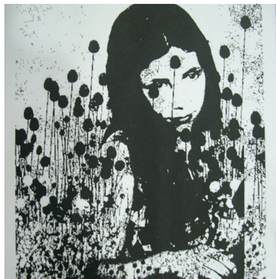
Producción para una página de artista de Victoria

En su proceso de trabajo para hacer la página de artista Victoria le sacó una foto digital a una foto analógica; luego, la trabajó con Word. Convirtió la imagen a escala de grises y produjo una polarización blanco/negro. Como no consiguió, según sus palabras, “una calidad óptima”, hizo de nuevo el mismo proceso, pero en lugar de registrar con una cámara digital la fotografía analógica, la escaneó. Después, incorporó texturas de tramas de telas y de estampados. Finalmente, con la impresora a chorro de tinta, realizó sobreimpresiones con las distintas imágenes que generó por medio de Word. En la imagen definitiva, como operación retórica, distinguimos el paralelismo entre la imagen fotográfica que muestra a la alumna cuando era una niña y los motivos vegetales. Esta comparación puede interpretarse como la asociación de la infancia con un momento de plenitud y de crecimiento. También puede pensarse como correlato entre la vida humana y la naturaleza y sus ciclos.