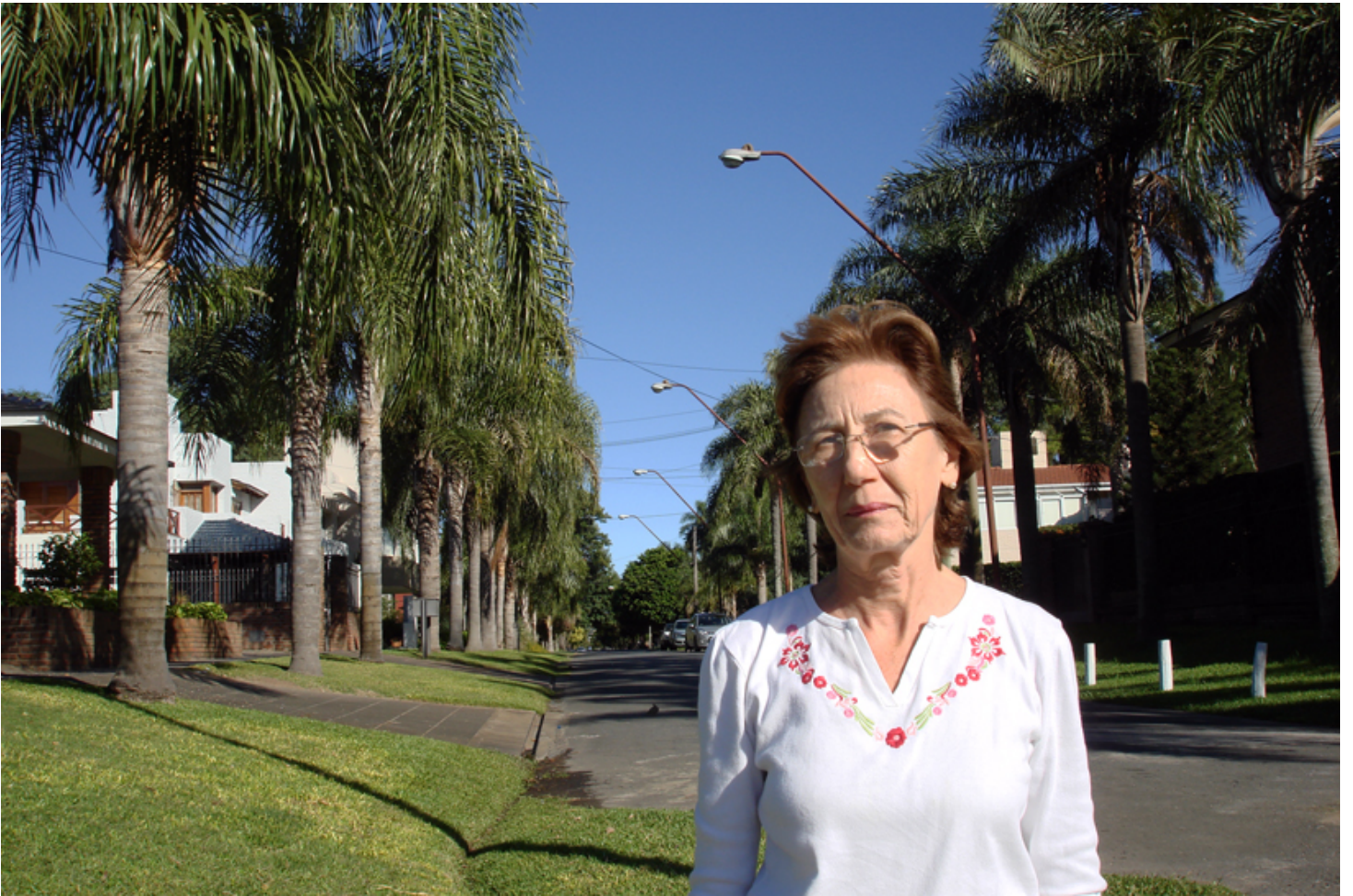
Villa Guadalupe, a orillas de la Laguna Setúbal, Santa Fe, marzo de 2014