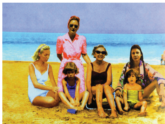
Mamá, mamá, abuela, abuela, yo y yo de vacaciones por fin (1997), Marcela Mouján. Revista Lápiz. Madrid: Estética y pensamiento

tas vacaciones imposibles, se nos presentan las miles de miradas de jóvenes mujeres y hombres que tenían el derecho a la vida. Todo eso que fue brutalmente eliminado.