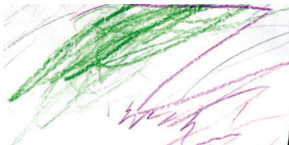
Garabato descontrolado. Trazos de un niño de dos años de edad, Alemania (2011)

Desde su estado latente, el garabato significa. Lleva consigo un núcleo secreto en el que se encuentra implícito su gran potencial. El garabato, desde su gestualidad, incorpora al mundo y se incorpora en el mundo. Luego, con el tiempo y en necesaria evolución, el garabato mutará su descontrol hacia un inicio de control, un intento de intención, una primera comprensión del efecto del gesto y de su movimiento; un primer descubrimiento de ese universo simbólico que comienza a abrirse y a desperezarse.