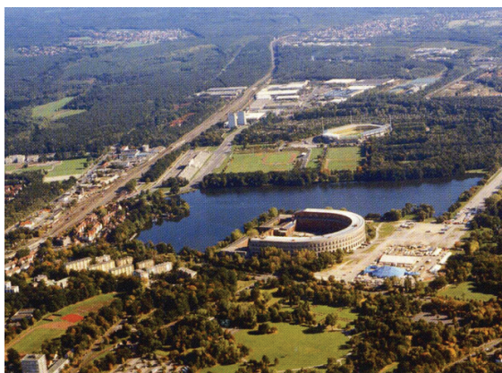
El predio Dutzendteich o Reichsparteitagsgelände con el Koloseo o Kongresshalle, Núremberg (1994). Revista Rund um den Dutzendteich . Nuremberg: Hofmann Druck

A partir del año 1933 el partido Nacional-socialista tomó este sitio para convertirlo en su área para celebraciones. Bajo la tutela de Albert Speer (el arquitecto del partido nazi) se proyectaron y construyeron los imponentes edificios que hasta el día de hoy se conservan. El proyecto final era colosal y lo que se llegó a concretar lo demuestra. El Kongresshalle o Koloseum abruma con su imponente presencia. Toda la arquitectura del nacionalsocialismo estuvo marcada por una ambiciosa nostalgia por los antiguos imperios (sobre todo el romano). El Kongresshalle es una prueba de esta ambición, una cita a aquel imperio.