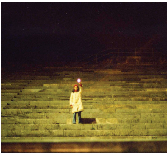
Einwanderung/Inmigración Yo (2004), Vanina Rodríguez