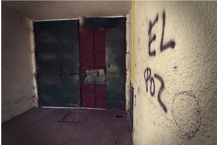
Pozo de Arana, aspecto actual interior. Página 12.