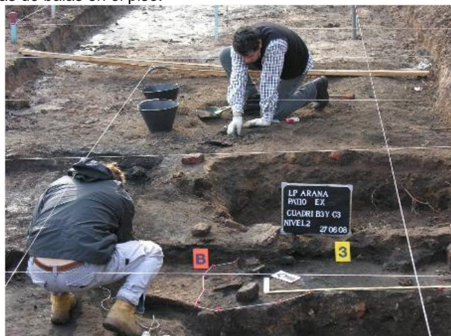
Capachas donde los antropólogos recogieron los huesos humanos