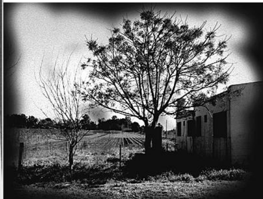
Ubicación e imagen Pozo De Arana