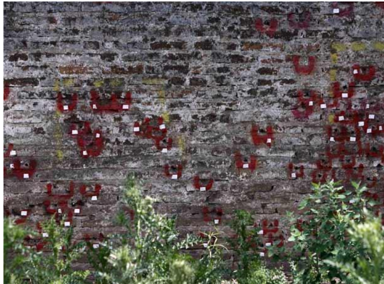
Disparos marcados en muro, presuntamente de fusilamiento. Se encontraron vainas de balas en el piso.