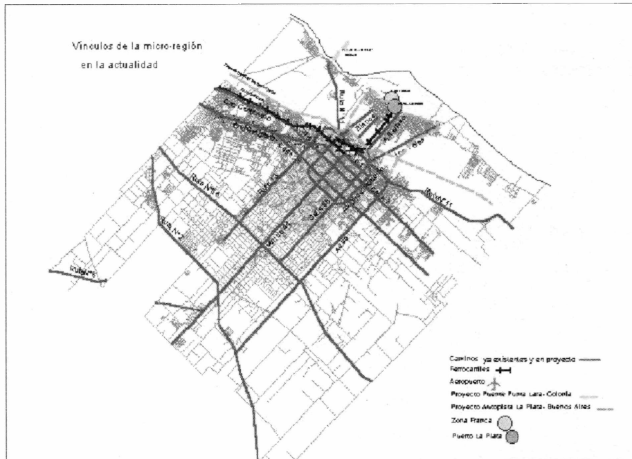
Figura 3: Sistema de Movilidad 2000