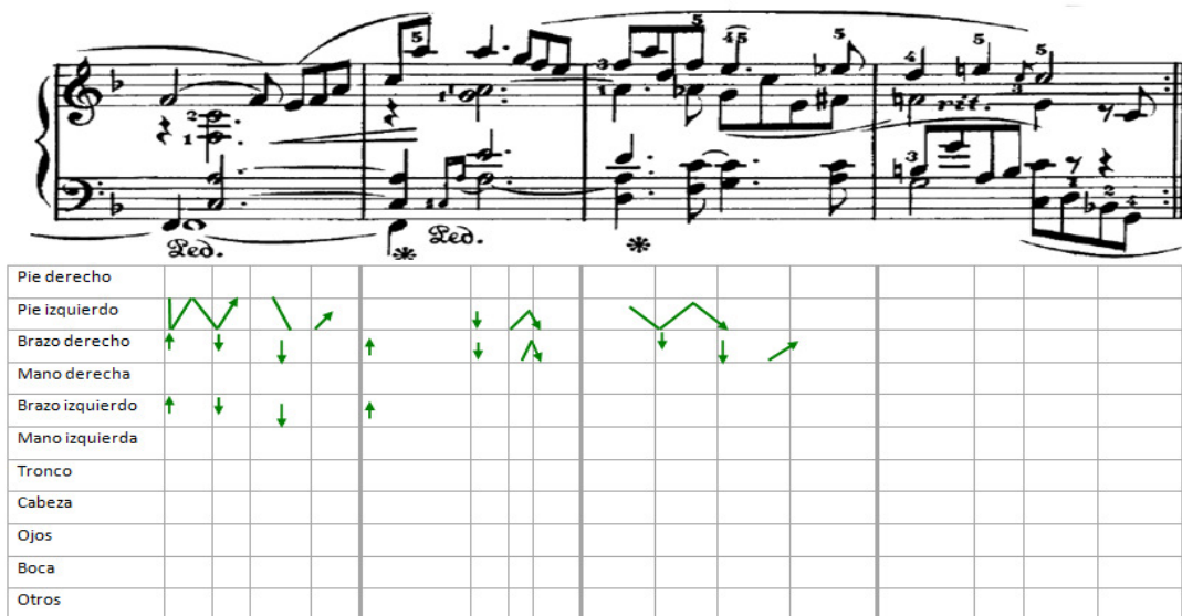
Figura 6: gráfico de las articulaciones corporales correspondientes a la repetición del consecuente

La figura 6 recoge la información correspondiente a la repetición del consecuente. El movimiento es escaso y con características similares al de la presentación del antecedente ya que las articulaciones corporales son breves y discontinuas aunque en este caso, más sutiles. Se encuentran en sincronía con los niveles del tactus y el subtactus .