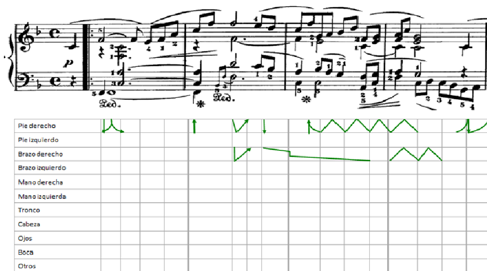
Figura 3: representación gráfica de las articulaciones corporales correspondientes al antecedente . Los extremos, el contorno y la longitud de las trayectorias de las flechas indican, respectivamente, los lugares métricos de inicio y finalización del movimiento, el uso del plano espacial y la duración del movimiento en número de unidades métricas.

En la figura 4 se puede ver el movimiento corporal durante el consecuente que comienza en el compás 5.