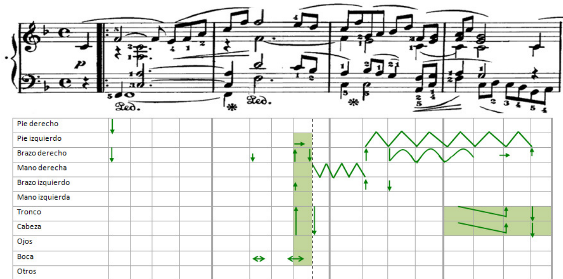
Figura 5: Gráfico de las articulaciones corporales correspondientes a la repetición del antecedente. Las celdas sombreadas refieren a movimientos globales que involucran más de un segmento corporal.

La figura 6 recoge la información correspondiente a la repetición del consecuente. El movimiento es escaso y con características similares al de la presentación del antecedente ya que las articulaciones corporales son breves y discontinuas aunque en este caso, más sutiles. Se encuentran en sincronía con los niveles del tactus y el subtactus .