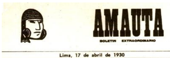
Figura 2: Boletín extraordinario por la muerte de Mariátegui.

Un artista que colaboró con Amauta , ilustrando sus portadas, fue José Sabogal 17 . De él es el diseño de la Cabeza de indio que será característica y sinónimo de la revista. Sabogal no sólo fue promotor de la cultura estética precolombina sino que tenía también, como José Mariátegui, un interés por lo social. Ello se advirtió en su activo liderazgo en el movimiento indigenista de Perú, aspecto que compartió con el Director de Amauta .