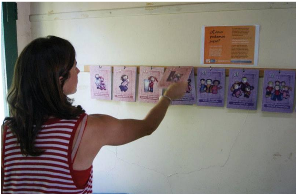
Juego de naipes. Propone, una vez finalizado el juego, la lectura y el debate sobre cuatro frases que enuncian los derechos. Son implementados por los niños y orientados por los responsables. Centro de Salud N°43.