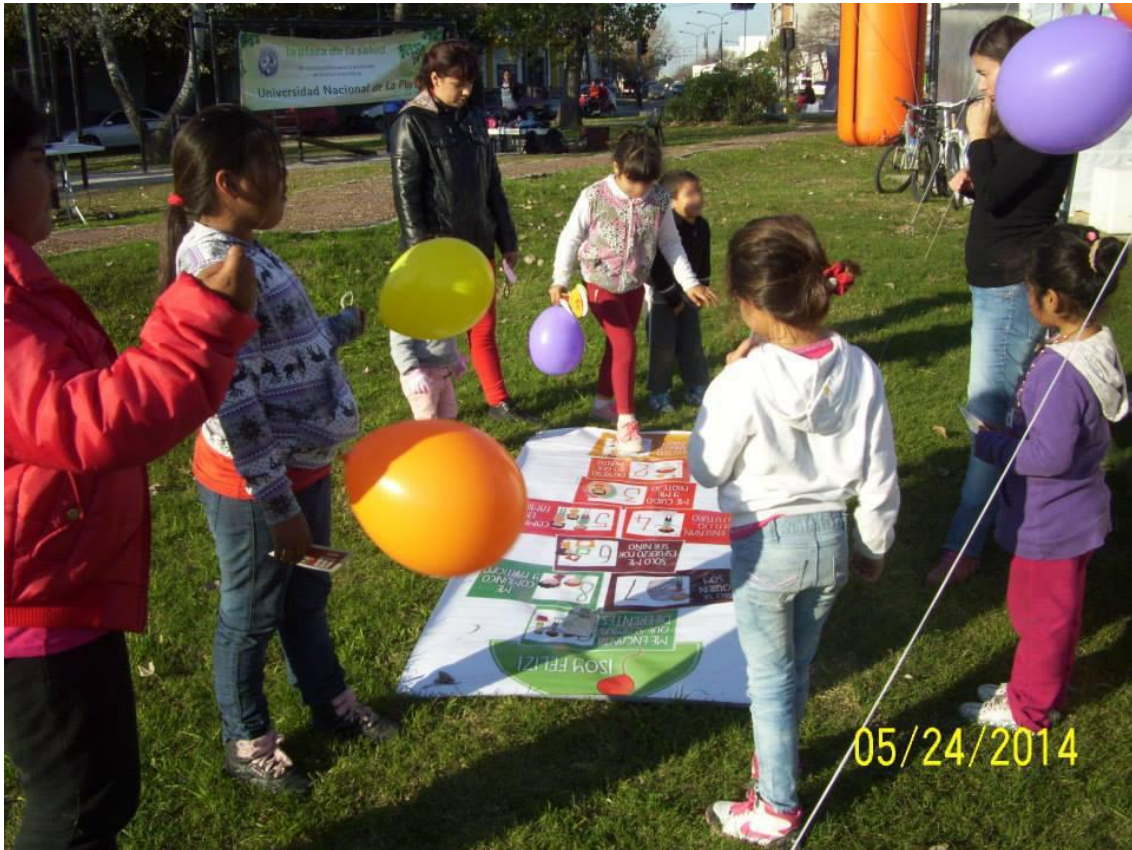
Tradicional rayuela que invita a reflexionar sobre los derechos. Proyecto de extensión "El desafío de prevenir la violencia en articulación con el Proyecto La Plaza de la Salud " ambos de la Facultad de Medicina.