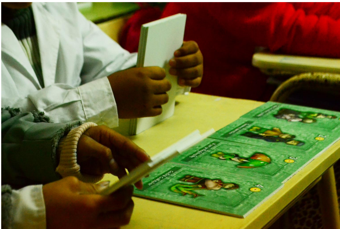
Juego de naipes. Escuela N°49. El Peligro. Actividad coordinada por alumnos de 5to año del Proyecto 2014.