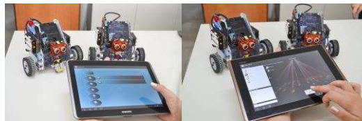
Figura 1 - Dos versiones de JDance

JDance permite definir ritmos de baile que los robots interpretarán. Con JDance el usuario puede indicarle a los robots que bailen ritmos pre-establecidos o crear ritmos nuevos de baile. Desde la aplicación Android, el usuario podrá diseñar nuevos ritmos de baile interactuando con una interfaz visual que representa los movimientos básicos que componen un ritmo. Los nuevos ritmos podrán guardarse para interpretarse en diferentes oportunidades. La Figura 1 muestra 2 versiones de JDance 6 .