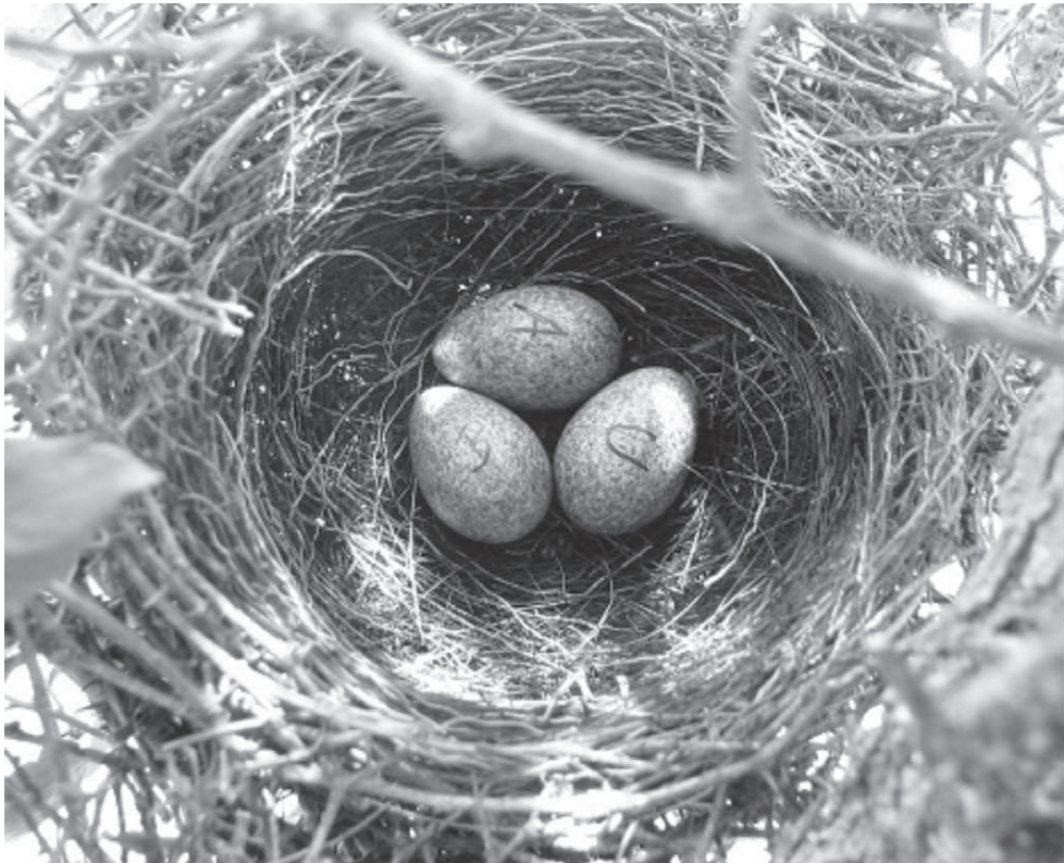
Fig. 5. Nido de Cardenal Común en los talaes de Punta Indio.

Los nidos ubicados sobre coronillo se encontraron a menor distancia de la periferia que los ubicados sobre tala. El hecho de que en coronillo los nidos sean ubicados más cerca del borde de la copa indicaría que la elevada densidad de follaje de esta especie permite el ocultamiento del nido a menor profundidad. También podría existir una desventaja asociada a la ubicación muy alejada del borde relacionada con el acceso de depredadores desde el tronco. Según Murphy, (1983) y Alonso et al. , (1991), los nidos a menor altura y en la zona central de la copa son más visibles y accesibles para los depredadores del suelo, mientras que los nidos más expuestos en la periferia son de fácil acceso para depredadores del aire y también expuestos a las adversidades climáticas. Götmark et al. , (1995) indicaron que existe un balance entre las ventajas de un mayor ocultamiento y la necesidad de mantener la visibilidad para detectar potenciales depredadores, individuos de la propia especie y fuentes de alimento. Wilson y Cooper, (1998) proponen que existe un balance entre la ventaja de evitar depredadores colocando los nidos en la periferia y la desventaja de la exposición a las condiciones climáticas adversas. La localización del nido podría depender de la importancia relativa de