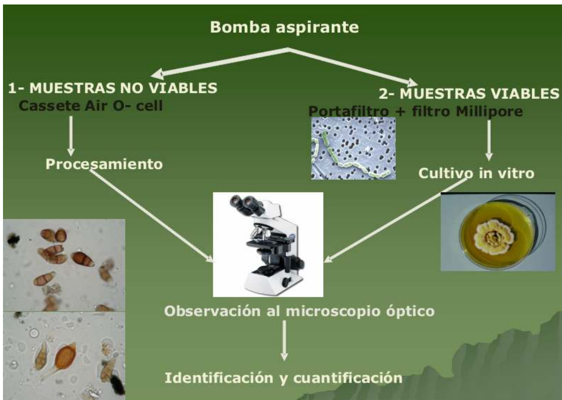
Fig. 4: Diagrama de flujo de la secuencia de muestreo de aire interior

En el momento de la toma de muestras, se registró la temperatura y humedad en cada recinto utilizando HOBBO U14 LCD Data logger.