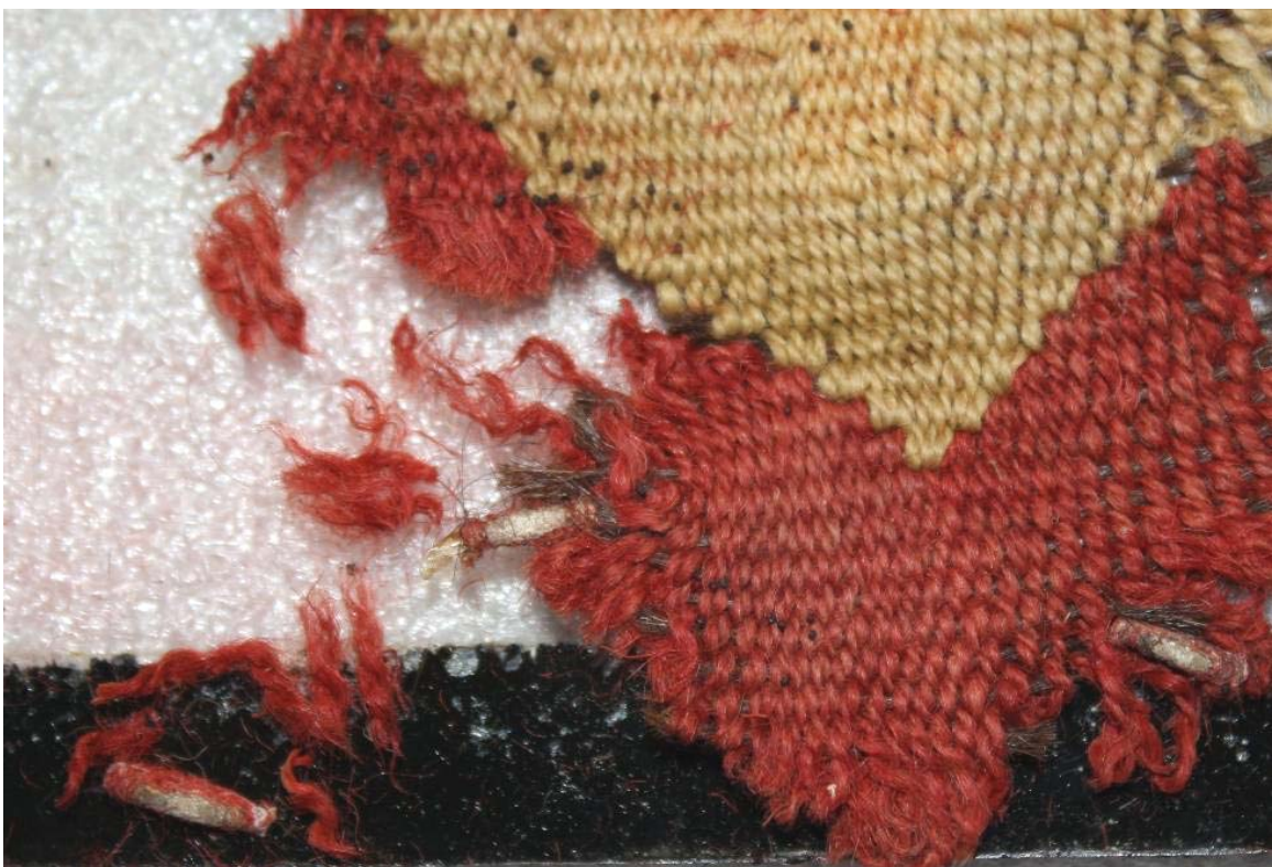
Imágenes 1 y 2 - Vista general de la pieza n° 60001 (arriba) y detalle en el que se observa evidencia de la acción de lepidópteros que dañaron la tela (abajo).